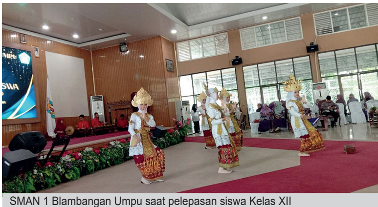
SMAN 1 Blambangan Umpu saat pelepasan siswa Kelas XII

meriahkan dengan berbagai acara hiburan persembahan dari sanggar tari SMA Negeri 1 Blambangan Umpu. Dalam kesempatan tersebut pihak sekolah juga memberi apresiasi kepada siswa-siswi berprestasi meraih nilai tertinggi, siswa berprestasi non akademik, serta yang lolos seleksi masuk perguruan