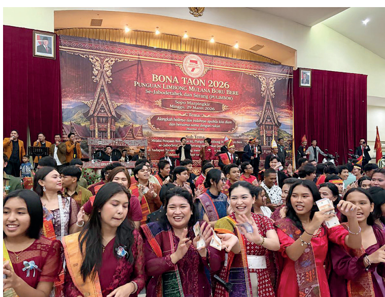
Para Remaja ikut manortor bersama sama.