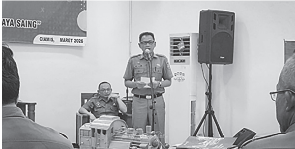
Dalam upaya memperkuat tata kelola pariwisata yang berdaya saing dan partisipatif, Dispar Kabupaten Ciamis menggelar Forum Perangkat Daerah dan Forum Konsultasi Publik di Aula Dinas Pariwisata Kabupaten Ciamis.