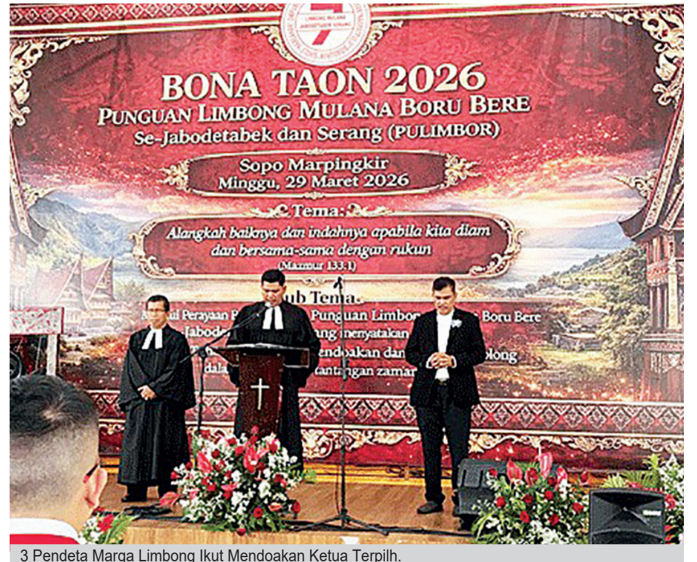
3 Pendeta Marga Limbong Ikut Mendoakan Ketua Terpilih.

anggota untuk memegang teguh falsafah Dalihan Na Tolu sebagai landasan kehidupan sosial, sehingga PULIMBOR Sejabodetabek Banten tetap kompak, solid, dan dihormati di tengah masyarakat.