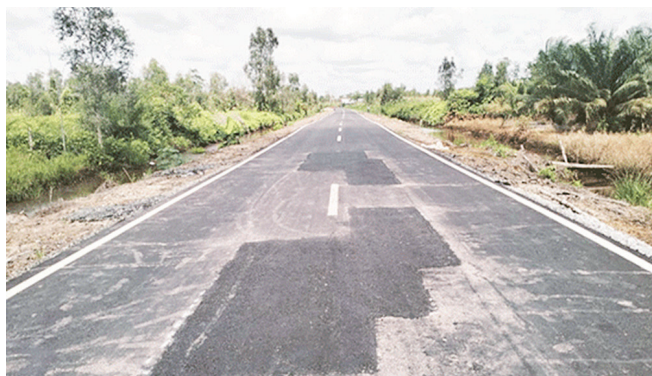
Proyek lanjutan Lanjutan Rekonstruksi Jalan Basarang (Desa Batuah) - Terusan - Batanjung, tahun 2025 menelan dana hampir Rp 20 Miliar, yang diduga dijadikan ajang korupsi.