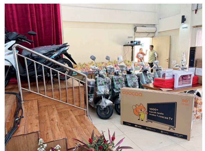
Door prize 2 unit motor, 6 unit motor listrik, 2 TV 50 in dan yang lainnya.