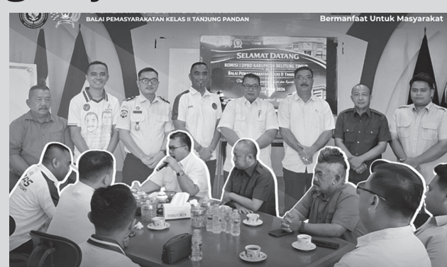
Balai Pemasarakatan (Bapas) Kelas II Tanjungpandan menerima kunjungan kerja Komisi I DPRD Kabupaten Belitung Timur memperkuat sinergi pelaksanaan tugas dan fungsi pemasarakatan yang humanis dan berbasis Hak Asasi Manusia (HAM).

Sementara Petaling difokuskan pada penguatan layanan pembimbingan klien secara terarah dan berkelanjutan untuk mendukung reintegrasi sosial.