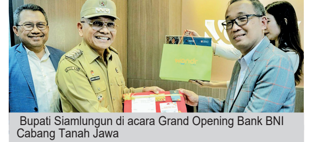
Bupati Simalungun di acara Grand Opening Bank BNI Cabang Tanah Jawa