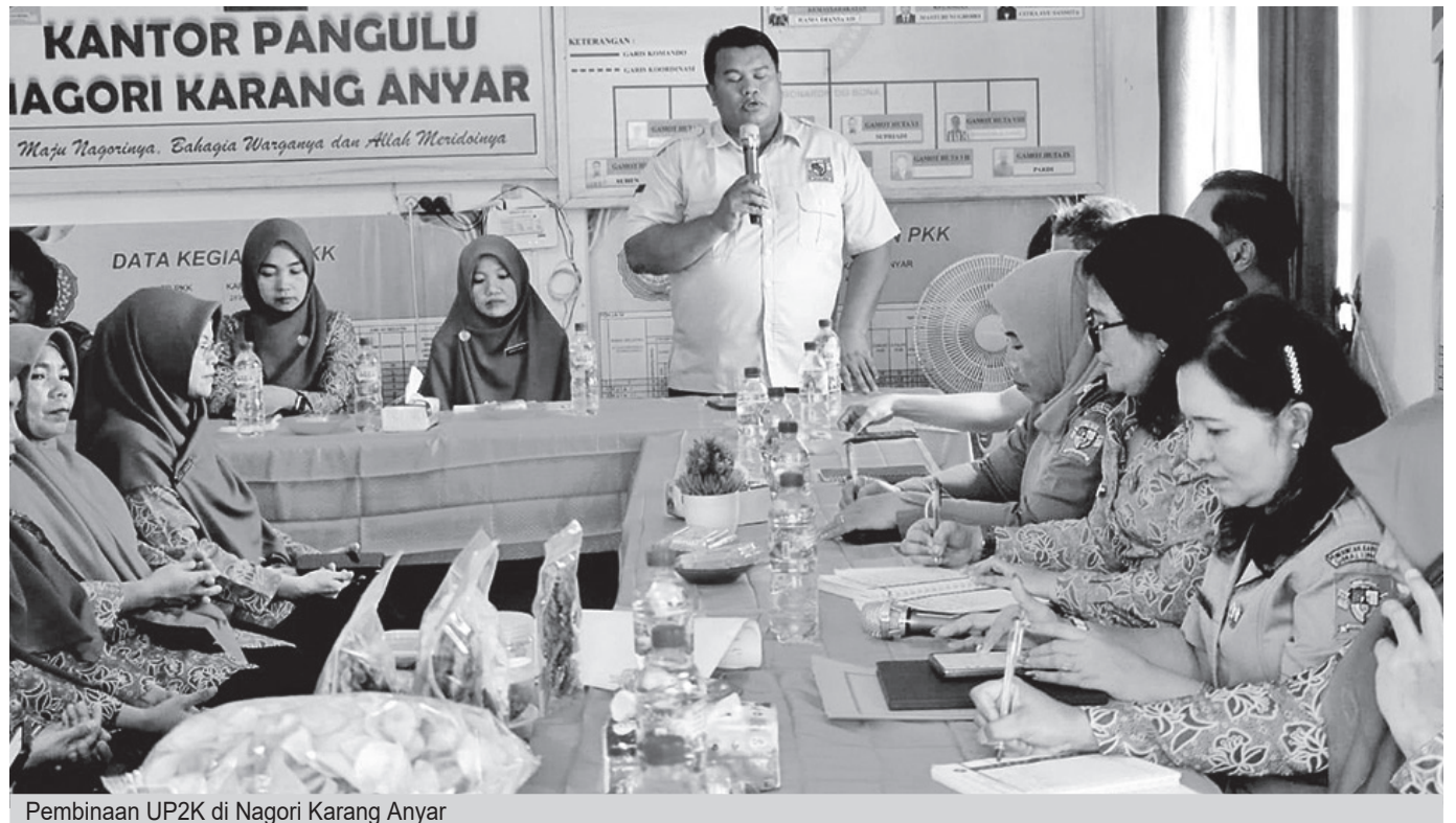
Pembinaan UP2K di Nagori Karang Anyar