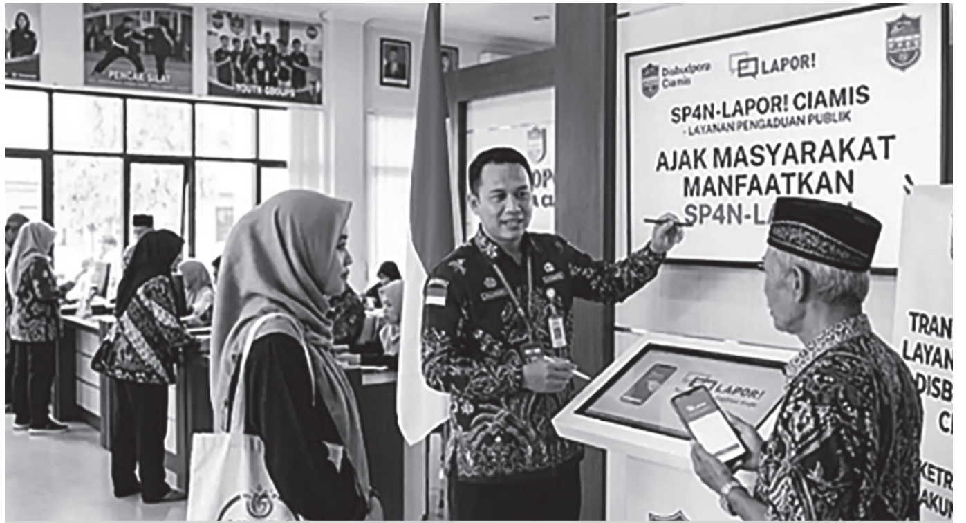
Disbudpora Ciamis meluncurkan gebrakan baru di awal tahun 2026.

Menurutnya, sinergi yang kuat antara pemerintah daerah dan masyarakat sangat dibutuhkan untuk mewujudkan pelayanan publik yang prima di Tatar Galuh. "Melalui sistem terpadu ini, setiap keluhan terkait kondisi fasilitas olahraga, program pembinaan pemuda yang mandek, hingga urusan pelestarian situs adat dan budaya dipastikan tidak akan mengendap begitu saja. Kami sangat terbuka terhadap masukan masyarakat. Melalui sistem SP4N-LAPOR!,