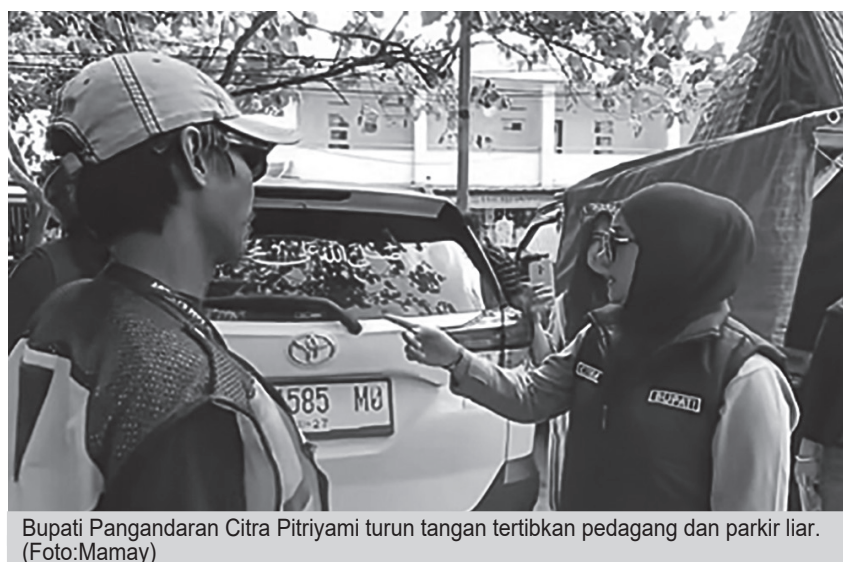
Bupati Pangandaran Citra Pitriyami turun tangan tertibkan pedagang dan parkir liar.

Sebelumnya, Bupati Pangandaran kembali menegaskan komitmennya dalam menata kawasan wisata Pantai Pangandaran. Dalam inspeksi men-