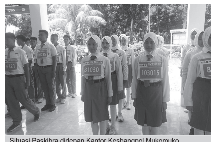
Situasi Paskibra di depan Kantor Kesbangpol Mukomuko

"Melihat kondisi persiapan anggaran daerah yang ada kita berencana akan melakukan pengurangan kuota pesonil Paskibra sebelumnya dari 36 orang pasukan menjadi 25 hingga 28 orang," ungkap Kaban Kesbangpol.