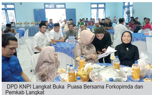
DPD KNPI Langkat Buka Puasa Bersama Forkopimda dan Pemkab Langkat

Kegiatan bertema "Pemuda Bersatu, Langkat Maju" tersebut berlangsung