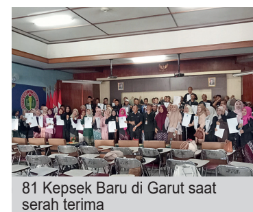
81 Kepsek Baru di Garut saat serah terima

Dinas pendidikan Kabupaten Garut banyak membutuhkan kepala sekolah baik SD maupun SMP. Sejak tahun 2025 kebutuhan tersebut dibuka oleh MENDAGRI yang telah mengundang langsung kepada setiap Guru yang berminat baik ASN