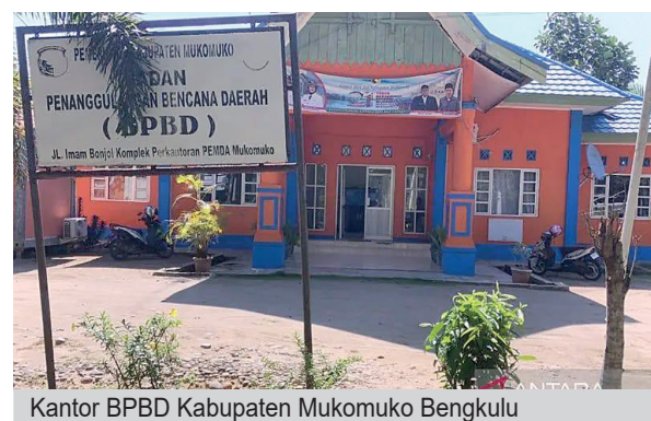
Kantor BPBD Kabupaten Mukomuko Bengkulu