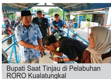
Bupati Saat Tinjau di Pelabuhan RORO Kualatungkal

Pemkab Tanjung Jabung Barat (Tanjabbar) kembali menegaskan komitmennya dalam menjamin keselamatan, keamanan, dan kenyamanan masyarakat selama arus balik Idulfitri 1447 Hijriah.