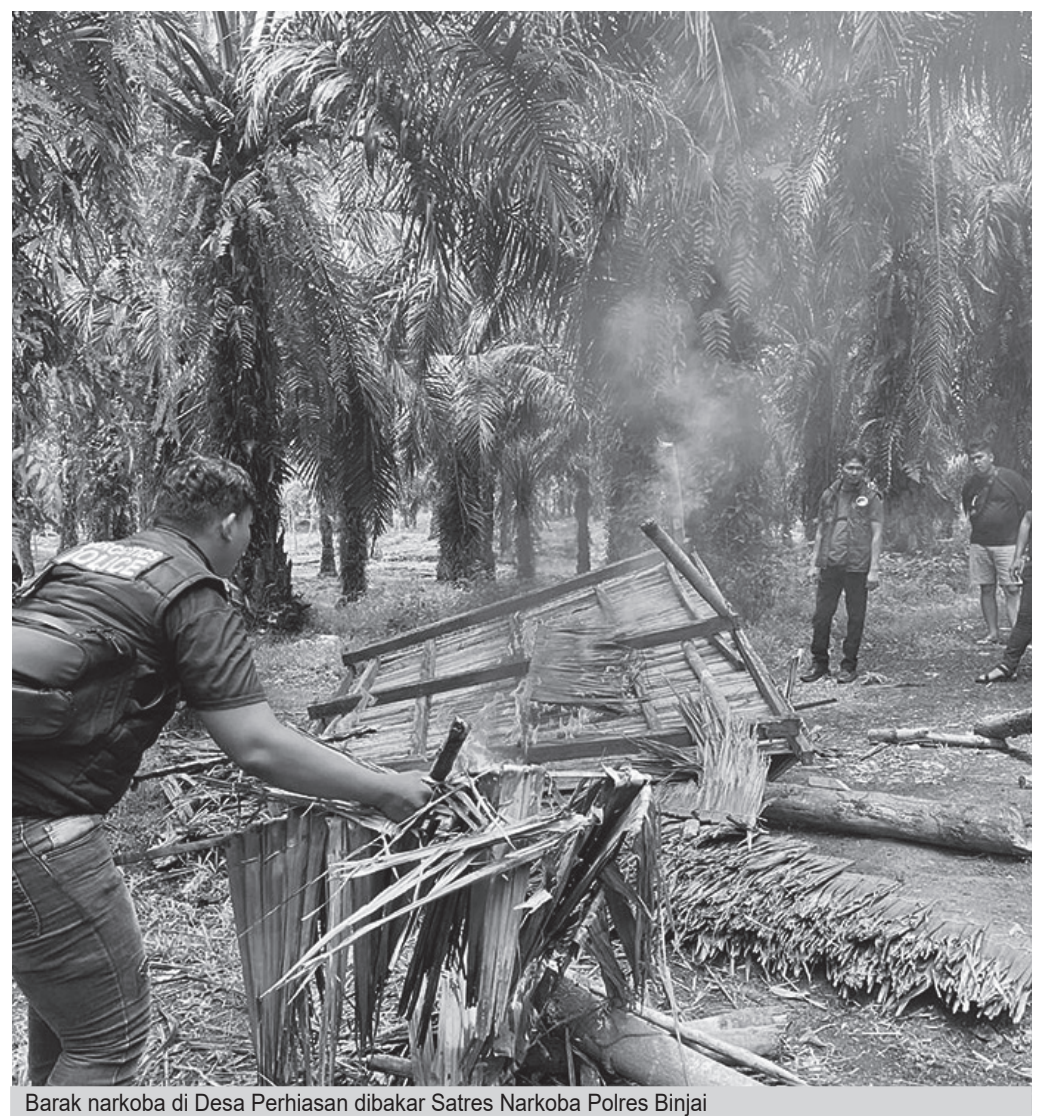
Barak narkoba di Desa Perhiasan dibakar Satres Narkoba Polres Binjai

Polisi juga mengimbau masyarakat untuk terus berperan aktif memberikan informasi guna membantu pemberantasan narkoba di wilayah tersebut. (Fatimah)