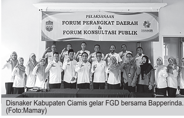
Disnaker Kabupaten Ciamis gelar FGD bersama Bapperinda.