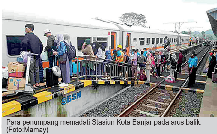
Para penumpang memadati Stasiun Kota Banjar pada arus balik.