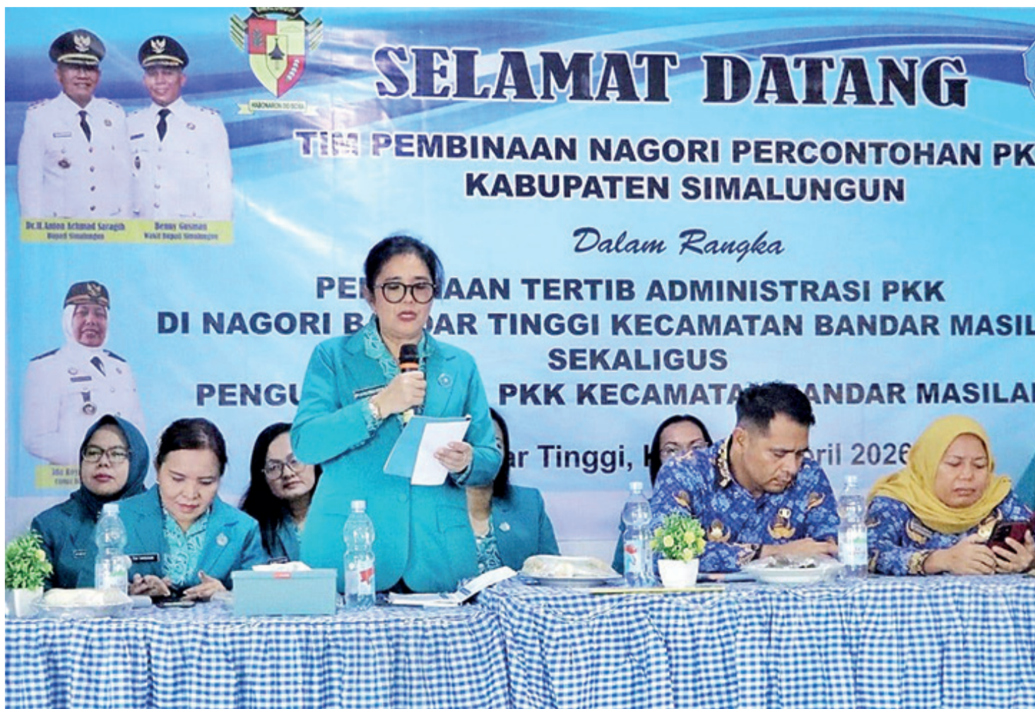
Ketua TP PKK Lakukan Nagori

Semangat Gotong-Royong Sambut Lomba PKK Babinsa Siantar Selatan Turun Langsung Bersama Warga