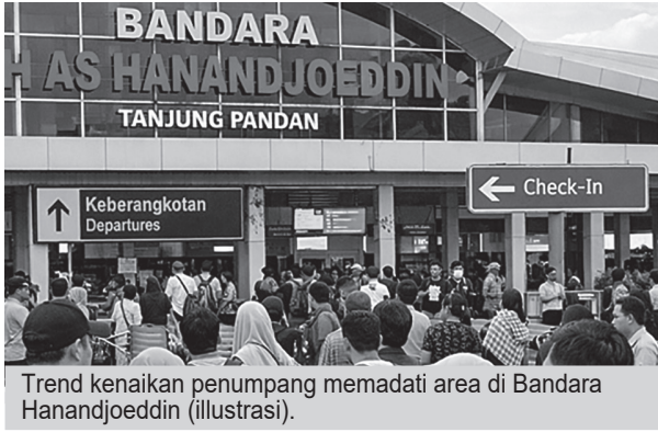
Trend kenaikan penumpang memadati area di Bandara Hanandjoeddin (ilustrasi).