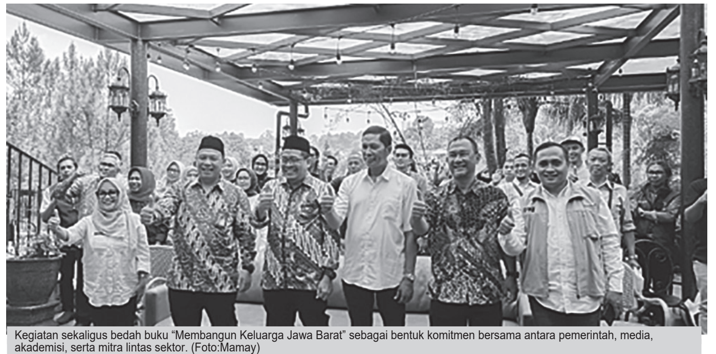
Kegiatan sekaligus bedah buku "Membangun Keluarga Jawa Barat" sebagai bentuk komitmen bersama antara pemerintah, media, akademisi, serta mitra lintas sektor.

juan menjaga lansia tetap sehat, mandiri, aktif, dan produktif. Di sisi lain, BKKBN turut mengembangkan Super Apps Keluarga Indonesia "Siap Bahagia". Aplikasi tersebut untuk memudahkan masyarakat mengakses informasi terkait peningkatan kualitas keluarga. Adang menambahkan, berbagai program tersebut merupakan bagian dari strategi pemanfaatan bonus demografi menuju Indonesia Emas 2045. Upaya tersebut diperkuat melalui transformasi kelembagaan serta penyusunan Peta Jalan Pembangunan Kependudukan. "Keluarga menjadi hulu dan hilir dalam pembangunan. Artinya, seluruh proses pembangunan kualitas manusia harus dimulai dari keluarga," katanya.