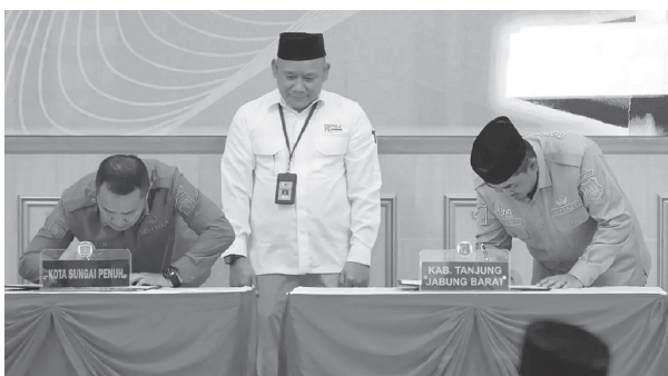
Bupati (kanan) Saat Tandatangani Naska di BPK RI Perwakilan Prov. Jambi