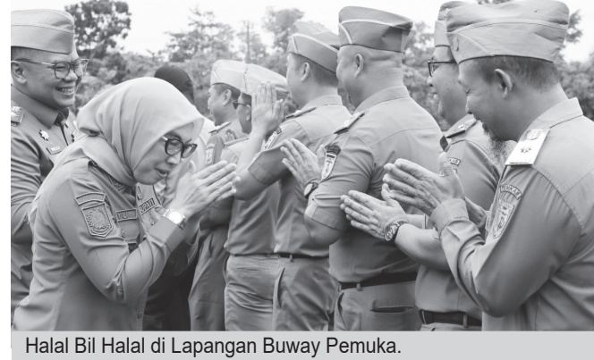
Halal Bil Halal di Lapangan Buway Pemuka.

Dalam arahannya, bupati juga mengajak seluruh jajaran untuk merefleksikan makna Idul Fitri. Ia mempertanyakan apa yang benar-benar tersisa