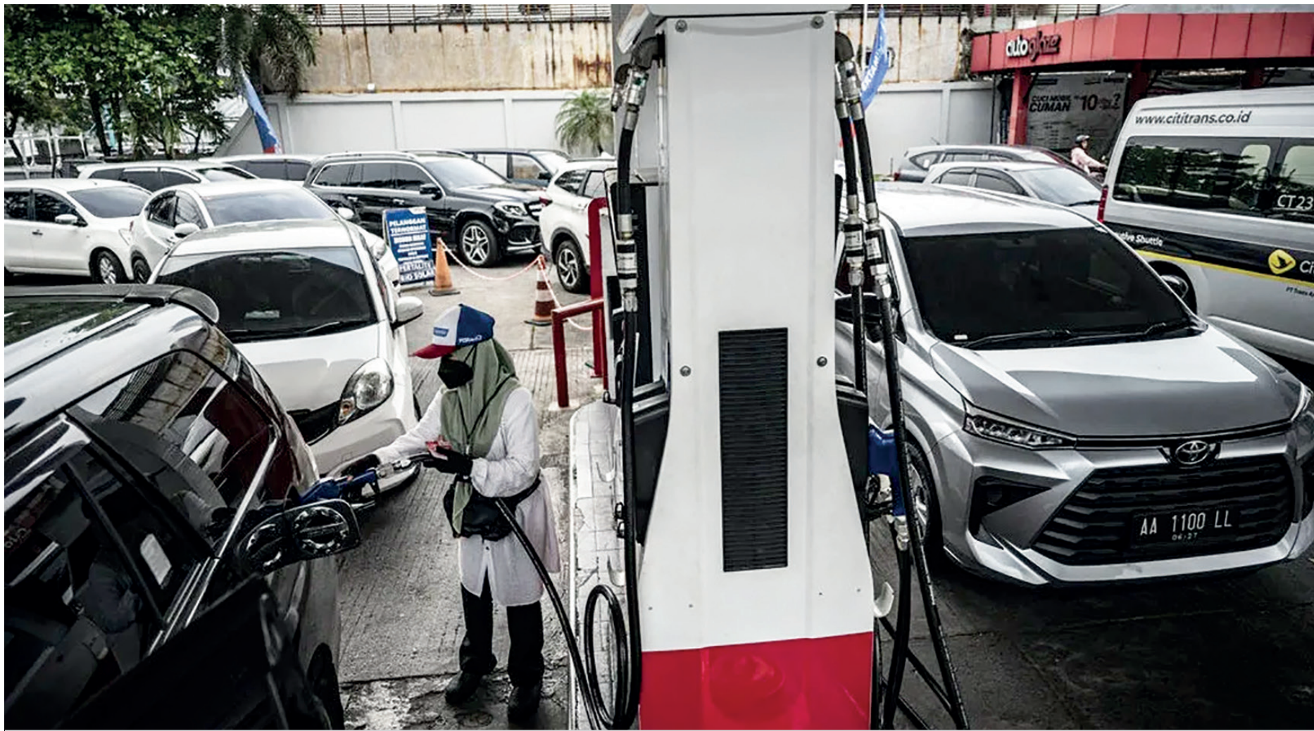
Petugas melayani pengisian bahan bakar minyak (BBM) jenis Pertamina di SPBU COCO Jalan Ahmad Yani, Semarang, Jawa Tengah, Selasa (31/3/2026).

Keputusan menahan harga Pertamina-Dexlite memicu pertanyaan tentang seberapa kuat pemerintah mampu menahan beban minyak mahal dan dampaknya ke fiscal.