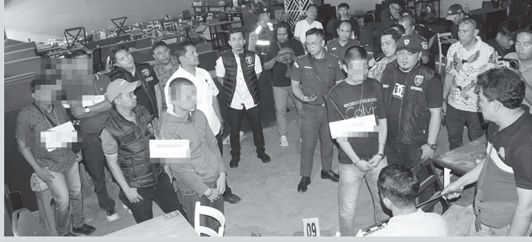
Rekonstruksi kasus pembunuhan peragaan 10 adegan

Selain kedua tersangka turut juga dihadiri 11 orang saksi yang menyaksikan langsung jalannya rekonstruksi untuk memberikan keterangan sesuai dengan peristiwa yang terjadi.