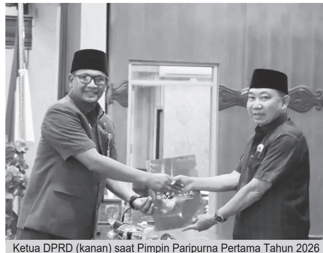
Ketua DPRD (kanan) saat Pimpin Paripurna Pertama Tahun 2026