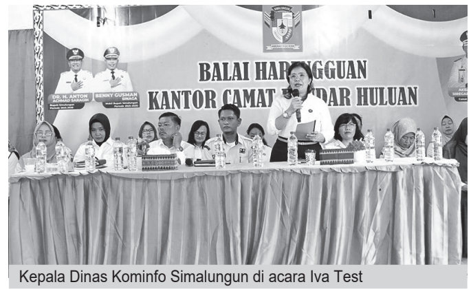
Kepala Dinas Kominfo Simalungun di acara Iva Test