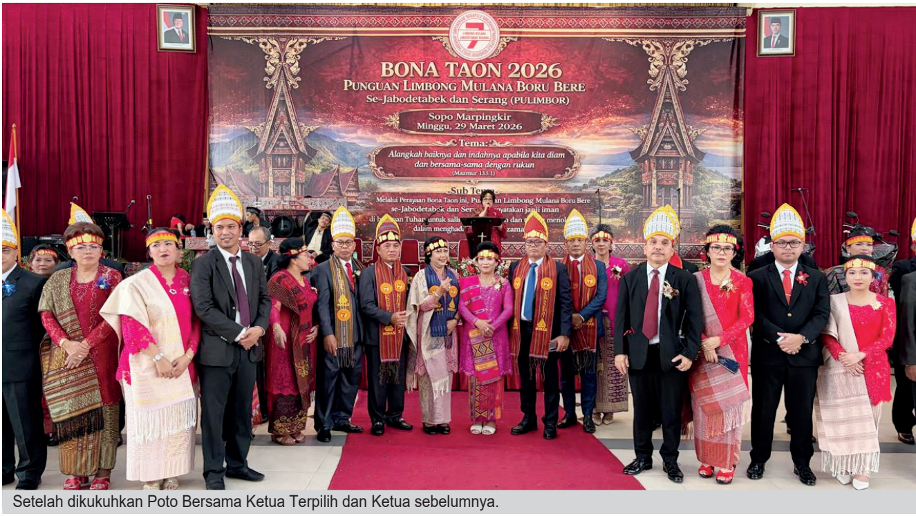
Setelah dikukuhkan Foto Bersama Ketua Terpilih dan Ketua sebelumnya.

Acara ditutup dengan doa bersama dan seluruh hadirin menyanyikan lagu "Oh Tano Batak," mengingatkan akan tanah leluhur yang selalu dirindukan. ***