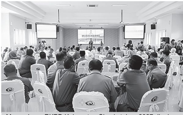
Musrenbang RKPD Kabupaten Ciamis tahun 2027 digelar di Aula Adipati Angganaya Bapperida, Senin (30/3).