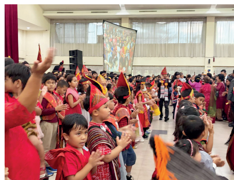
Anak anak juga ikut manortor sambil menerima saweran dari orang tua.