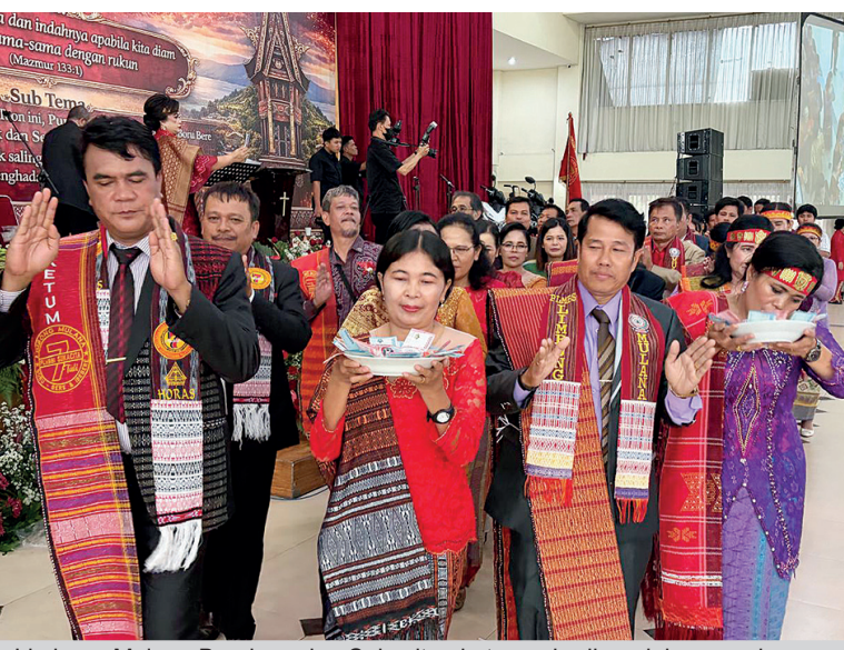
Limbong Mulana Bandung dan Sukacita ikut memberikan dukungan dengan memberikan santi santi