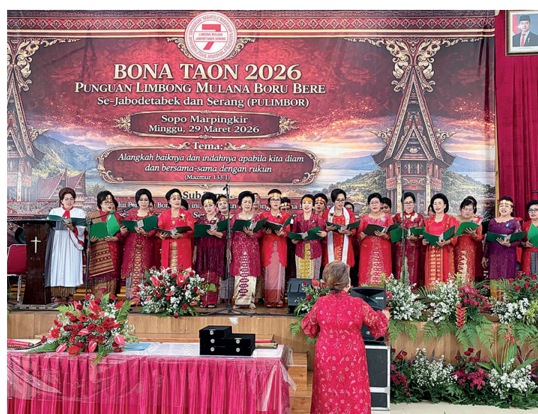
Koor Paropmuan Limbong Mulana Sejabodetabek Banten.