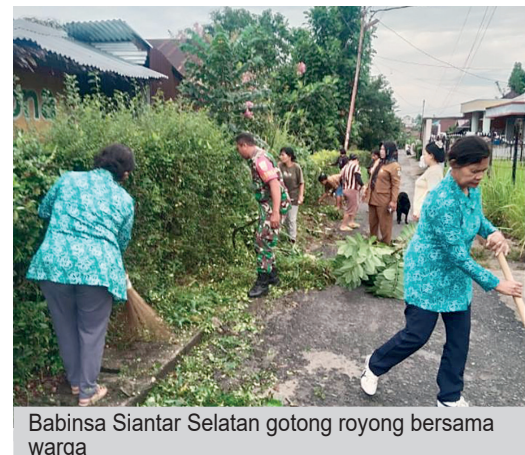
Babinsa Siantar Selatan gotong royong bersama warga

Semangat Gotong-Royong Sambut Lomba PKK Babinsa Siantar Selatan Turun Langsung Bersama Warga