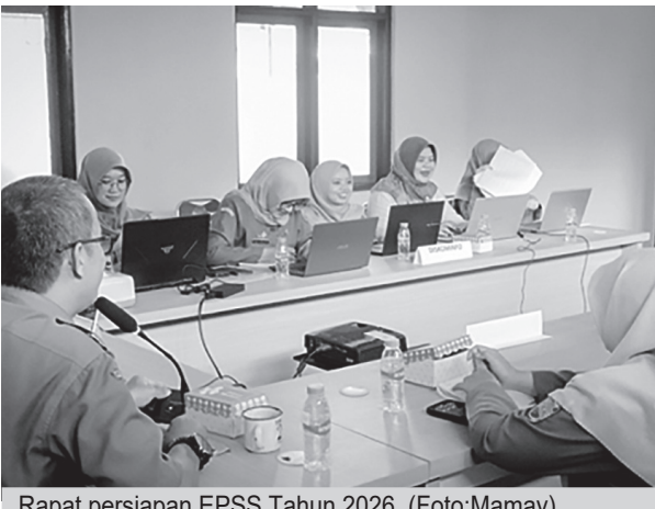
Rapat persiapan EPSS Tahun 2026.