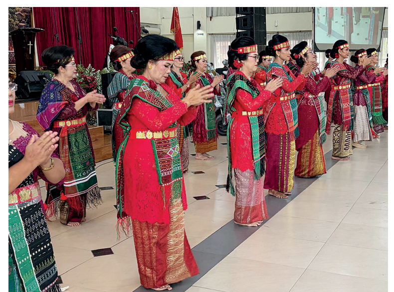
Tortor Kreasi Paropmuan Limbong Mulana Sejabodetabek Banten.