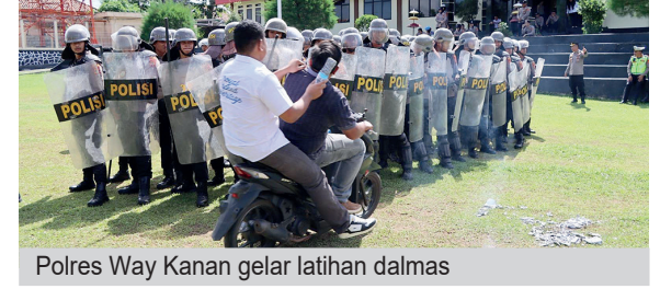
Polres Way Kanan gelar latihan dalmas