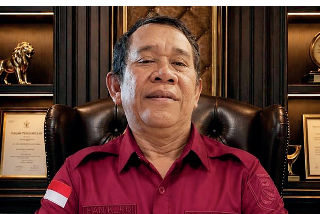
Waketum DPP Bara Hati Indonesia