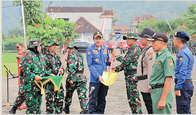
Wabup Trenggalek menyerahkan skop kepada anggota TNI sebagai penanda TMMD ke 128 resmi dimulai di Desa Sukorejo Kecamatan Gandusari, Rabu (22/4/2026).

Menurut Kasrem, untuk sasaran utamanya adalah peningkatan kondisi jalan penghubung antara Desa Su-