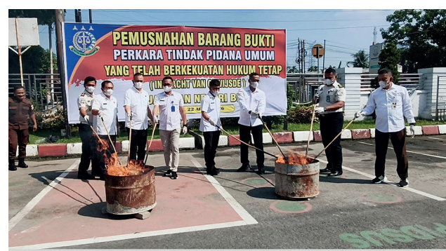
Kaban Kesbangpol hadir pemusnahan barang bukti kejahatan di Kejaksaan Binjai, Rabu (22/4/2026)

Kegiatan ini dihadiri perwakilan Pemerintah Kota Binjai melalui Badan Kesatuan Bangsa dan Politik Kota Binjai, aparat kepolisian, serta Badan Narkotika Nasional sebagai bentuk sinergi