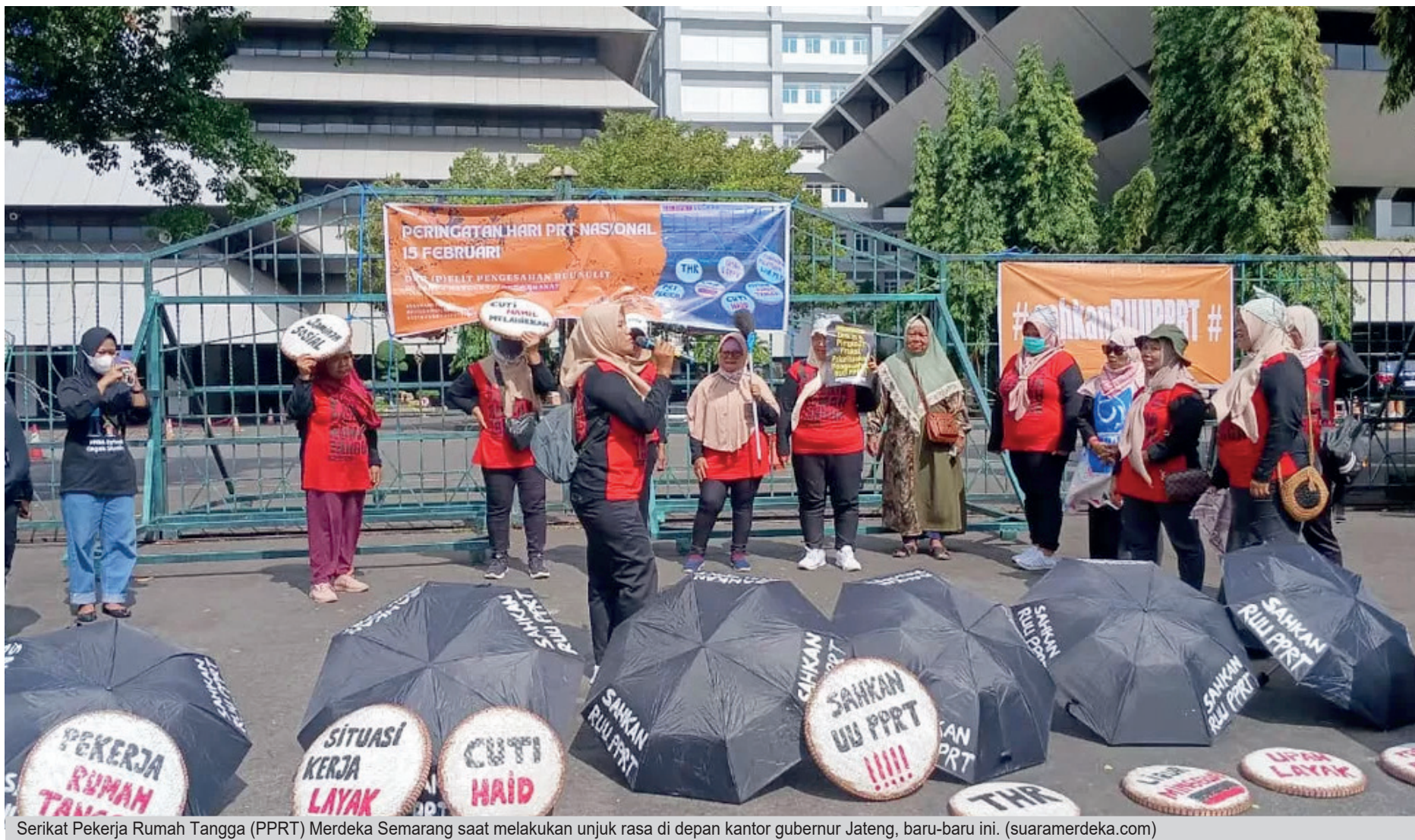
Serikat Pekerja Rumah Tangga (PPRT) Merdeka Semarang saat melakukan unjuk rasa di depan kantor gubernur Jateng, baru-baru ini.

Setelah lebih dari dua dekade penantian, Undang-Undang Perlindungan Pekerja Rumah Tangga (UU PPRT) akhirnya resmi disahkan pada 21 April 2026. Regulasi ini menjadi langkah penting negara dalam memberikan kepastian hukum sekaligus perlindungan bagi jutaan pekerja rumah tangga di Indonesia.