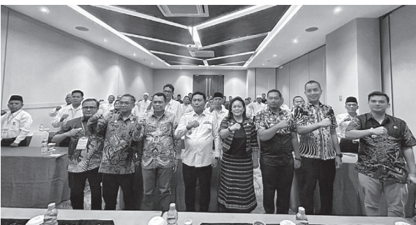
Wakil Bupati Deli Serdang, Lom Lom Suwondo SS, buka acara kegiatan Seleksi Tambahan Bakal Calon Kepala Desa pada Pilkades Serentak Gelombang II Tahun 2026 di Wing Hotel Kualanamu, Kecamatan Batang Kuis, Jumat (17/4/2026)