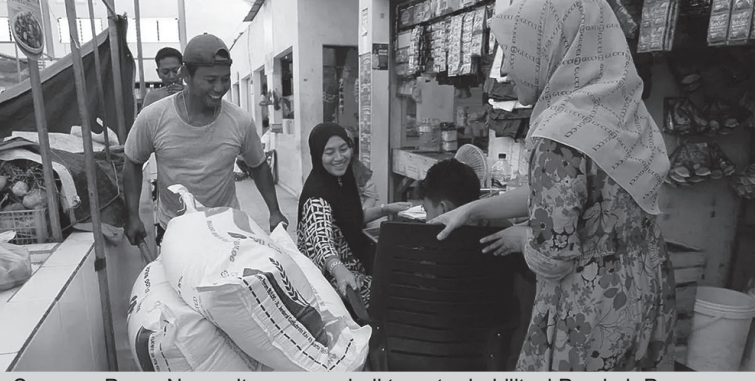
Suasana Pasar Ngempit yang menjadi target rehabilitasi Pemkab Pasuruan tahun ini

Seluruhnya tetap sesuai dengan hasil survei dan usulan yang diajukan pada tahun sebelum-