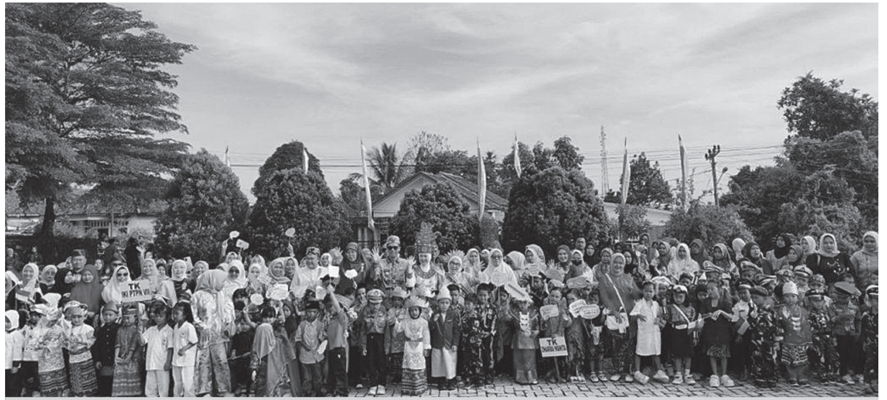
Bupati Way Kanan melepas peserta Karnaval Budaya Anak anak PAUD