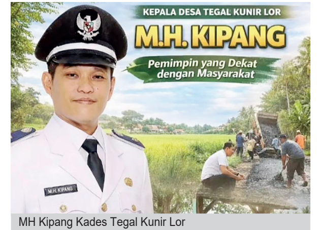
MH Kipang Kades Tegal Kunir Lor