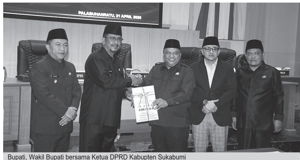
Bupati, Wakil Bupati bersama Ketua DPRD Kabupaten Sukabumi