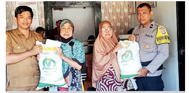
Sebanyak 384 kepala keluarga (KK) menerima bantuan berupa beras masing-masing 20 kilogram (dua karung @10 kg) serta minyak goreng kemasan MinkaKita