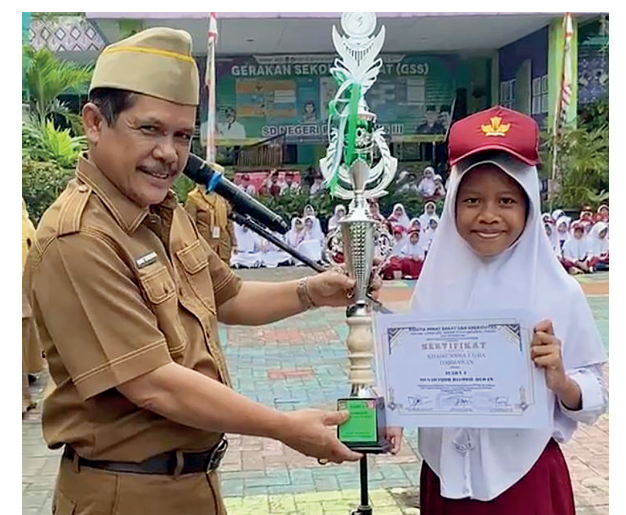
Salah satu murid SDN Pasar Kemis 3 terima piala Lomba Seni dan Sastra