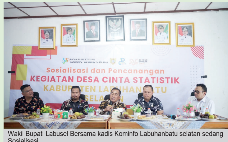
Wakil Bupati Labusel Bersama kadis Kominfo Labuhanbatu selatan sedang Sosialisasi.

Menurutnya, kehadiran Desa Cantik menjadi bagian dari upaya mewujudkan tata kelola pemerintahan desa yang modern, trans-