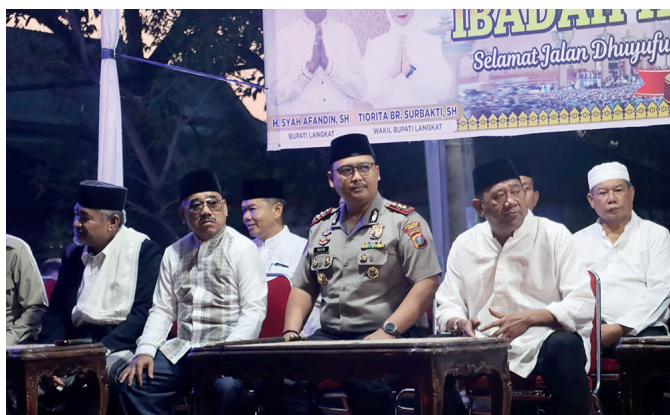
Kapolres Langkat menghadiri pelepasan jemaah haji kloter 2 tahun 2026, Rabu (22/4/2026)

Sebanyak 353 calon jemaah haji diberangkatkan dalam kloter ini, terdiri dari 130 laki-laki dan 223 perempuan. Acara pelepasan dimulai sejak pukul 04.00 WIB dan dihadiri unsur Forkopimda, tokoh agama, serta keluarga