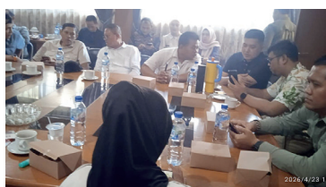
Komisi IV DPRD Kabupaten Sukabumi audensi dengan Disdik

Menindaklanjuti laporan yang disampaikan oleh Lembaga Swadaya Masyarakat Gerakan Aktivistis Peduli Untuk Rakyat (LSM GAPURA) kepada sekretariat DPRD, jajaran Komisi IV