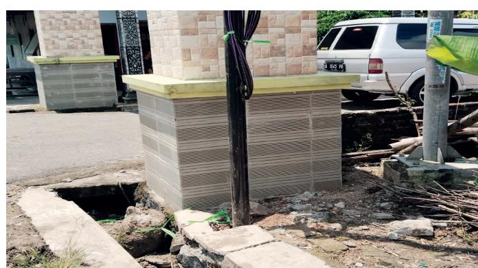
Bukti kerusakan saluran air akibat pemasangan tiang jaringan WiFi yang diduga milik PT. My Republik