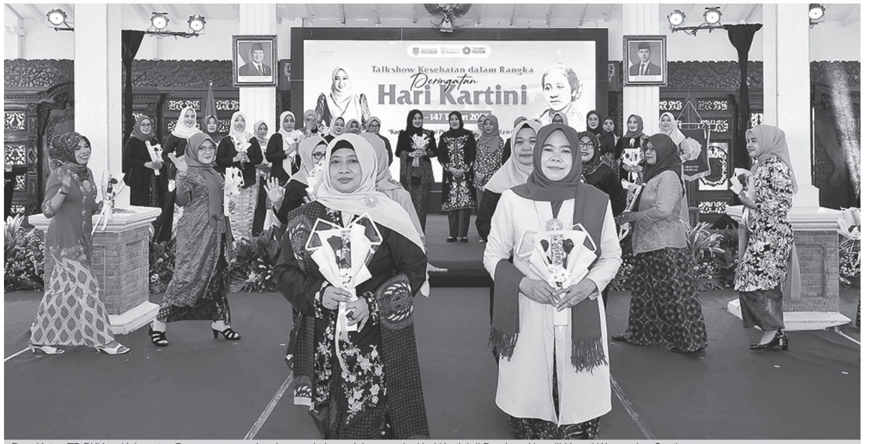
Para Ketua TP PKK se Kabupaten Pasuruan peragakan busana kebaya dalam rangka Hari Kartini di Pendopo Nyawiji Ngesti Wenganing Gusti