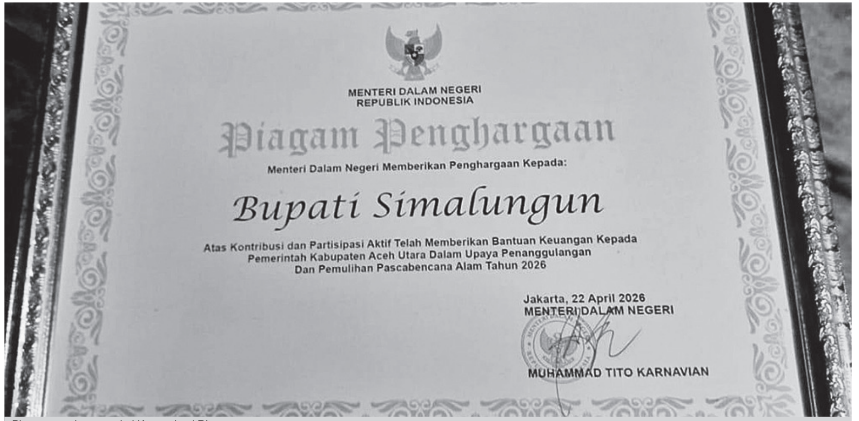
Piagam penghargaan dari Kemendagri RI