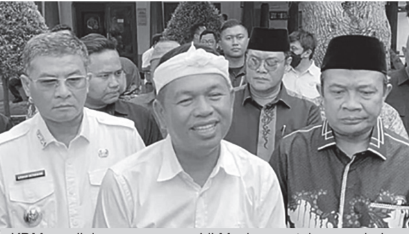
KDM menilai penyewaan mobil Maskara untuk menyalurkan MBG sah-sah saja dilakukan selama memenuhi prinsip transparansi.