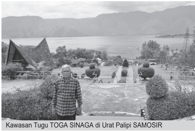
Kawasan Tugu TOGA SINAGA di Urat Palipi SAMOSIR

Di kawasan Danau Toba, peluang itu terbuka lebar. Perubahan pola konsumsi masyarakat, misalnya, dari memasak sendiri menjadi membeli makanan siap saji, telah melahirkan pasar baru bagi usaha kuliner lokal. Ini adalah ruang yang bisa diisi generasi muda melalui inovasi