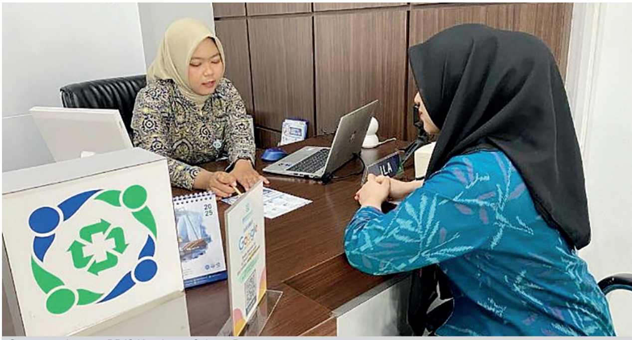
Suasana pelayanan BPJS Kesehatan Cabang Pasuruan

Dalam upaya meningkatkan kemudahan layanan, BPJS Kesehatan terus menghadirkan berbagai inovasi. Salah satunya melalui aplikasi Mobile JKN