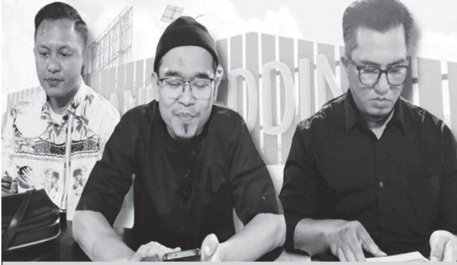
Bandara H.AS Hanandjoeddin Siaga Sambut Penerbangan Internasional Singapura-Tanjungpandan

"Seluruh petugas telah kami siagakan sesuai tugas dan fungsi masing-masing. Kami ingin memastikan pelayanan berjalan optimal se-