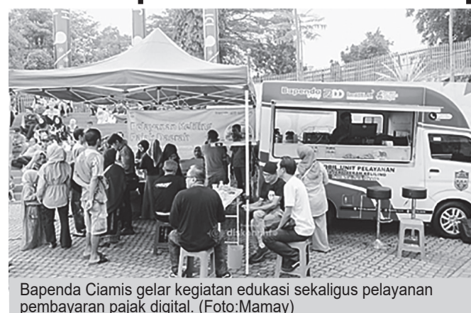
Bapenda Ciamis gelar kegiatan edukasi sekaligus pelayanan pembayaran pajak digital.

masyarakat sudah dapat melakukan pembayaran melalui berbagai kanal digital seperti QRIS, Virtual Account (VA), hingga aplikasi perbankan digital. Langkah ini menjadi bagian dari akselerasi Elektrifikasi Transaksi Pemerintah Daerah (ETPD) guna mengoptimalkan Pendapatan