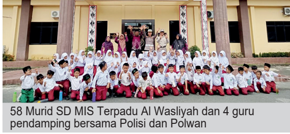
58 Murid SD MIS Terpadu Al Wasliyah dan 4 guru pendamping bersama Polisi dan Polwan