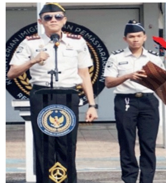
Lapas Tanjungpandan Deklarasi Zero Halinar Komitmen Bersama, Ciptakan Lapas Bersih dari Peredaran Narkoba

Lapas Tanjungpandan Deklarasikan Zero Halinar 2026 Perkuat Komitmen Wujudkan Lapas Bersih dari Narkoba