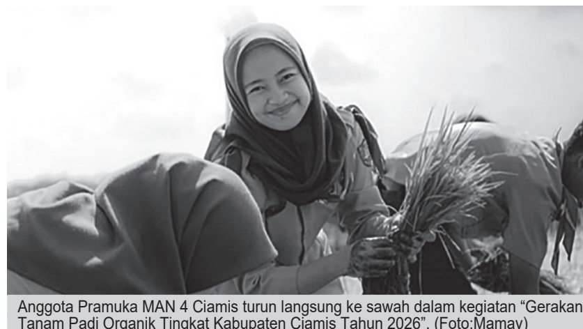
Anggota Pramuka MAN 4 Ciamis turun langsung ke sawah dalam kegiatan "Gerakan Tanam Padi Organik Tingkat Kabupaten Ciamis Tahun 2026".

Hari mengatakan, kegiatan tersebut bukan sekadar seremonial, melainkan