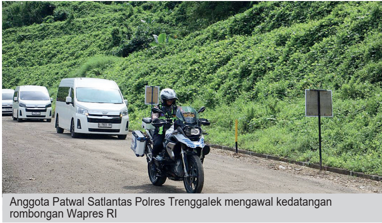
Anggota Patwal Satlantas Polres Trenggalek mengawal kedatangan rombongan Wapres RI