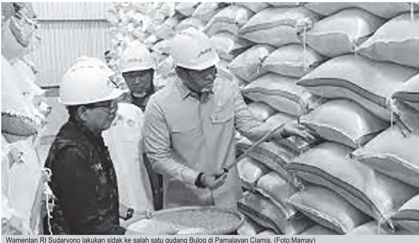
Wamentan RI Sudaryono lakukan sidak ke salah satu gudang Bulog di Pamalayan Ciamis.

Dijelaskannya, beras yang masuk ke gudang Bulog hanya sekitar 10 hingga 15 persen dari total produksi nasional. Sementara lebih dari 80 persen hasil panen langsung beredar di masyarakat. "Jadi jangan disalahpahami seolah-olah semua beras ada di gudang Bulog. Ini hanya bagian yang