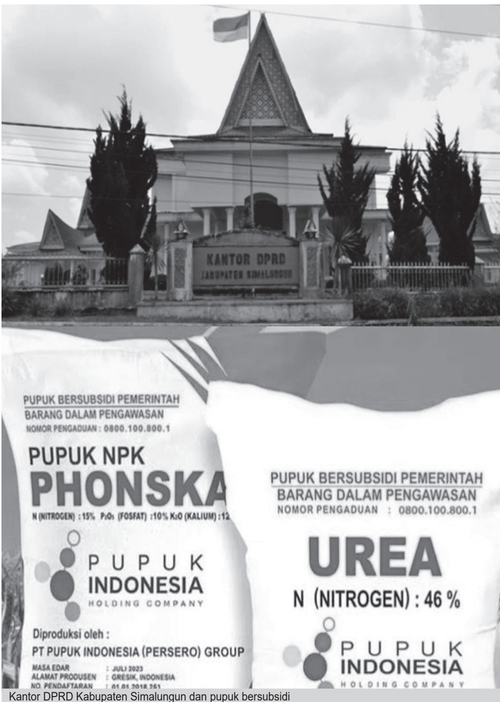
Kantor DPRD Kabupaten Simalungun dan pupuk bersubsidi

melibatkan kepentingan keluarga atau kelompok tertentu, maka hal tersebut dapat bertentangan dengan prinsip pemerintahan desa yang bersih.