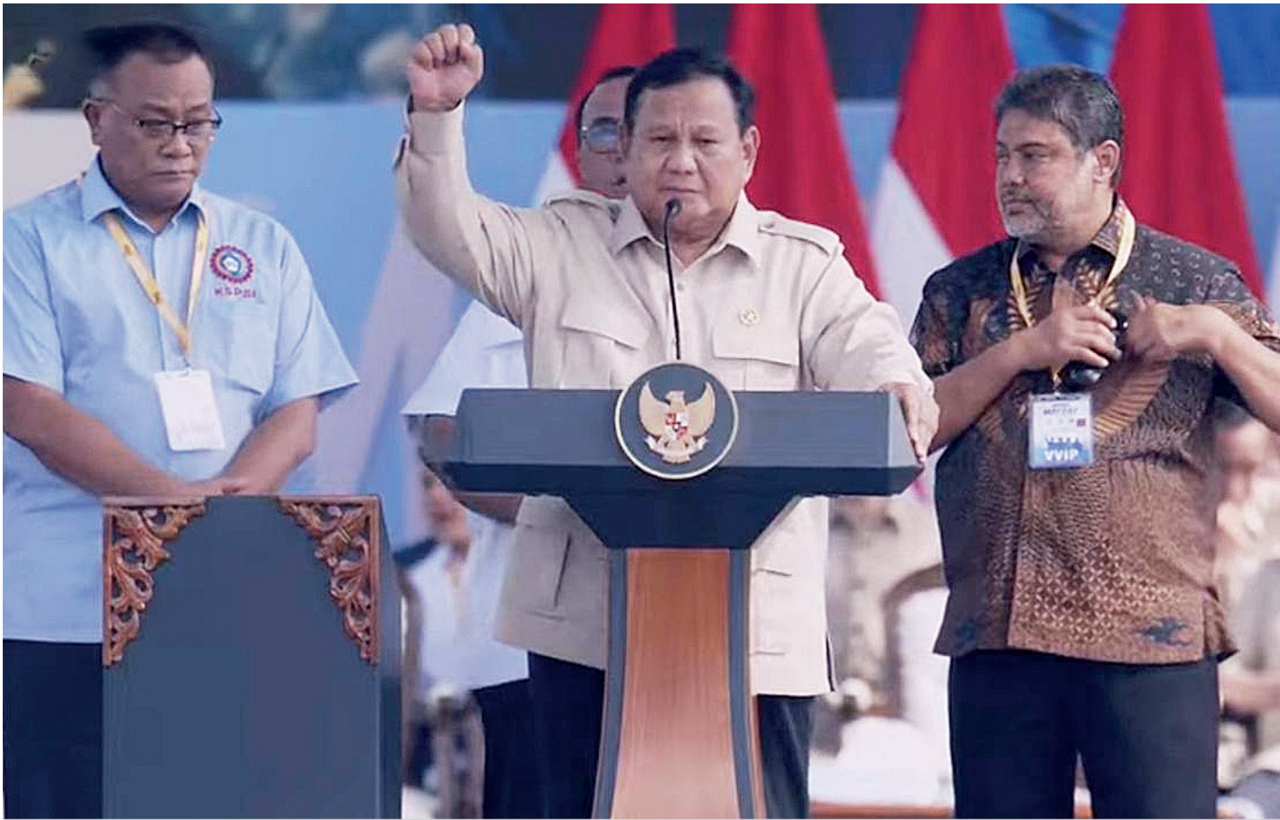
Presiden Prabowo Subianto mengaku telah memerintahkan menteri untuk segera menyelesaikan Rancangan Undang-Undang Ketenagakerjaan.