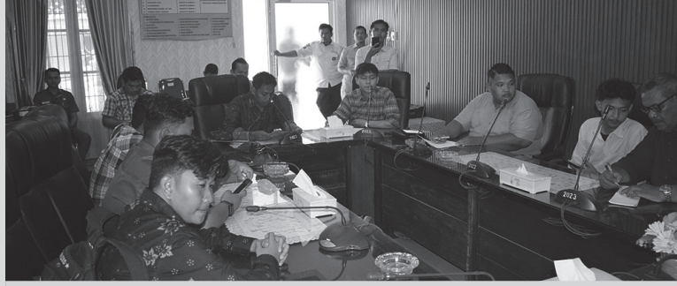
Aksi mahasiswa diterima Komisi I DPRD Langkat terkait dugaan Perambahan hutan lindung, Selasa (28/4/2026)

Mahasiswa meminta agar Kesatuan Pengelola Hutan (KPH)