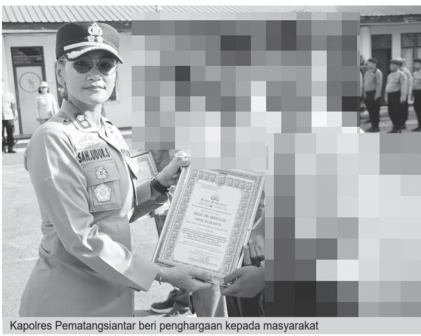
Kapolres Pematangsiantar beri penghargaan kepada masyarakat

Kapolres menyampaikan bahwa pemberian penghargaan tersebut merupakan momentum penting bagi institusi untuk menjaga dan melindungi masyarakat yang telah membantu tugas Kepolisian.