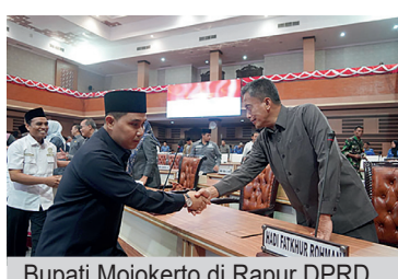
Bupati Mojokerto di Rapur DPRD

Dewan Perwakilan Rakyat Daerah (DPRD) Kabupaten Mojokerto menggelar Rapat Paripurna (Rapur) yang diselenggarakan di ruang Graha Whicessa Kantor Dewan, Jl Raden Ajeng Basoe-