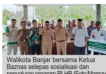
Walikota Banjar bersama Ketua Baznas selepas sosialisasi dan penyaluran program RLHB.

Baznas Kota Banjar bersama Pemerintah Kota (Pemkot) Banjar terus berkomitmen dalam peningkatan kualitas hidup masyarakat melalui program rehabilitasi Rumah Tidak Layak Huni