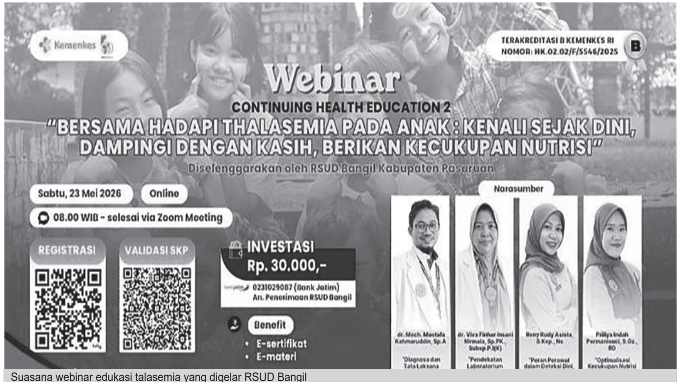
Suasana webinar edukasi thalasemia yang digelar RSUD Bangil

"Melalui webinar ini, kami ingin mengajak masyarakat dan tenaga kesehatan untuk lebih mengenali thalasemia sejak dini, memberikan pendampingan yang tepat, serta memastikan kebutuhan nutrisi