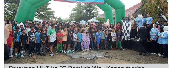
Perayaan HUT ke 27 Pemkab Way Kanan meriah