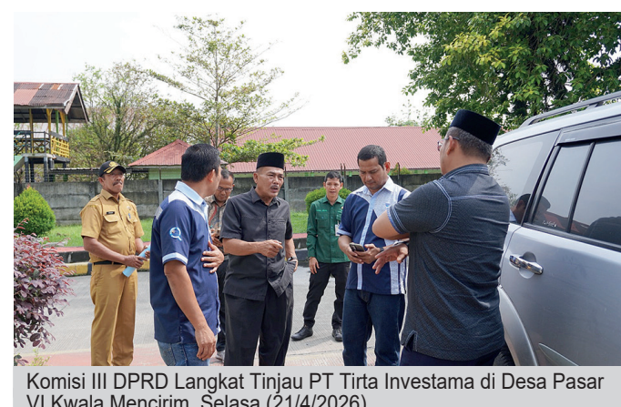
Komisi III DPRD Langkat Tinjau PT Tirta Investama di Desa Pasar VI Kwalu Mencirim, Selasa (21/4/2026)