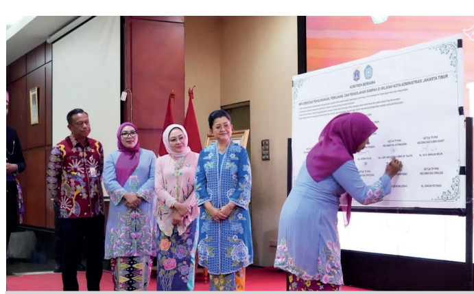
PKK Jakarta Timur Deklarasikan Gerakan Pilah Sampah