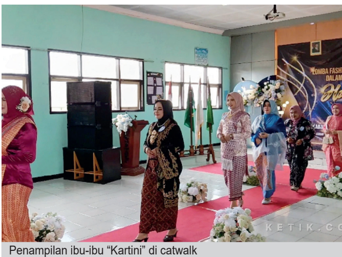
Penampilan ibu-ibu "Kartini" di catwalk

Dengan mengangkat semangat perempuan berdaya dan pendidikan berkualitas, kegiatan ini mencerminkan peran aktif DWP dalam mendukung terciptanya generasi