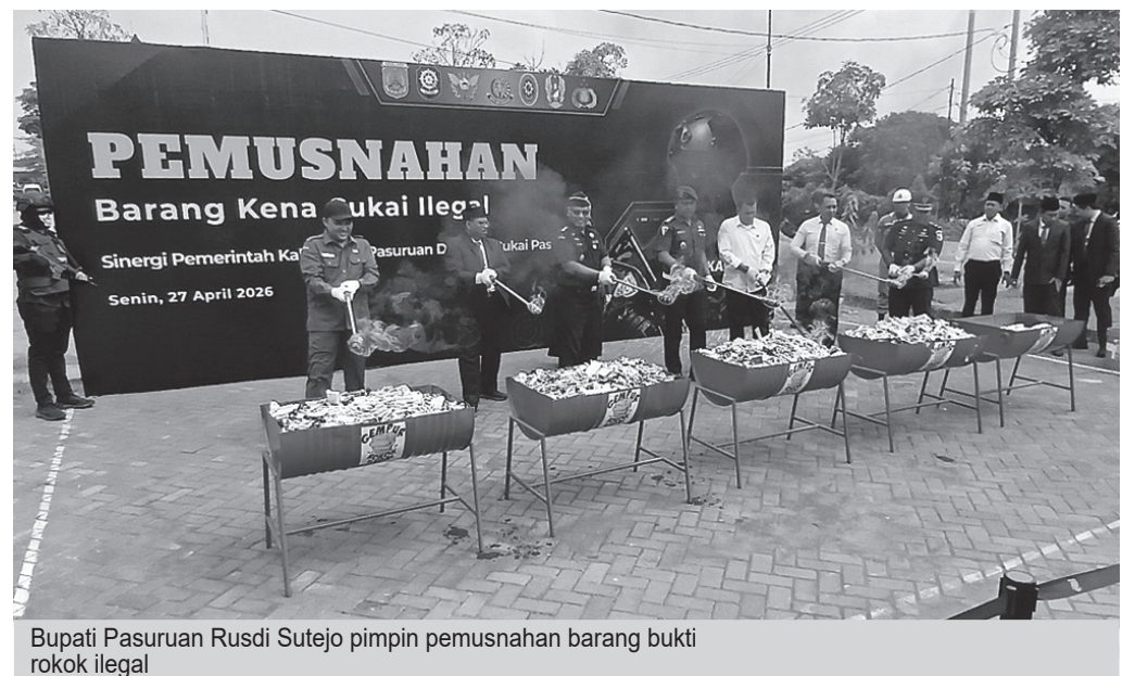
Bupati Pasuruan Rusdi Sutejo memimpin pemusnahan barang bukti rokok ilegal

Kepala Bea Cukai Pasuruan Hatta Wardhana menjelaskan, barang yang dimusnahkan didominasi rokok tanpa pita cukai sebanyak 4.233.186 batang dengan berat sekitar 8,4 ton.