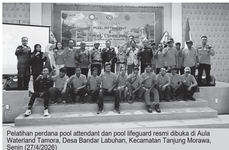
Pelatihan perdana pool attendant dan pool lifeguard resmi dibuka di Aula Waterland Tamora, Desa Bandar Labuhan, Kecamatan Tanjung Morawa, Senin (27/4/2026)

"Kami mengucapkan terima kasih atas dukungan dan fasilitas yang telah diberikan. Ke depan, kami berharap Balawista dan Waterland Tamora dapat menjadi mitra