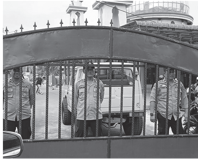
Kesiapsiagaan ditingkatkan Polresta Deli Serdang gelar Sispam Mako

"Seluruh personel harus meningkatkan kewaspadaan dan disiplin dalam menjalankan tugas pengamanan di setiap titik yang telah ditentukan. Laksanakan prosedur sesuai