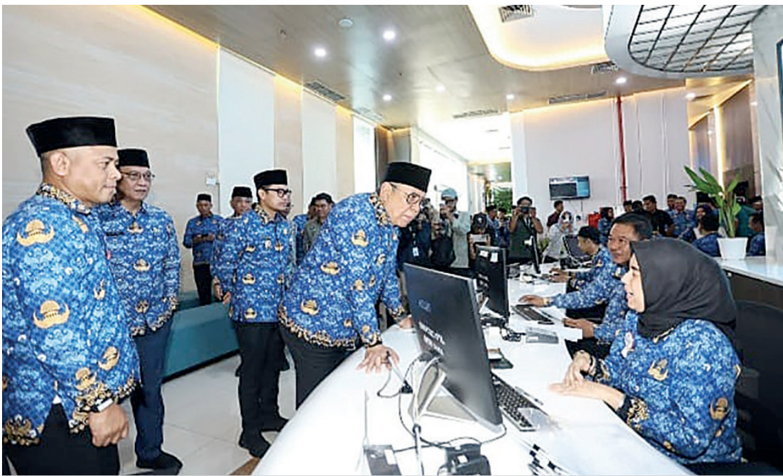
Wali Kota Tangerang Selatan, Benyamin Davnie meninjau gedung baru pelayanan Badan Pendapatan Daerah dan Dinas Kependudukan dan Pencatatan Sipil di kawasan Cilenggang Serpong.