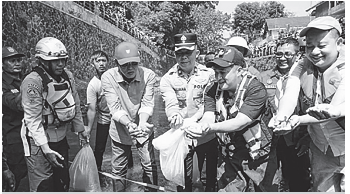
Bupati Ciamis Herdiat Sunarya bersama para publik figur menebarkan 150.000 benih ikan di aliran Sungai Cileueur.

Perbincangan di pendopo berlanjut hangat saat membahas inovasi pengelolaan