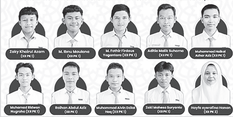
10 siswa MAN 1 Darussalam Ciamis yang diterima di Universitas Al-Azhar Mesir

Kepala MAN 1 Darussalam Ciamis H Dayat SPd MSi, menyampaikan apresiasi yang setinggi-tingginya atas keberhasilan para siswa. H Dayat menyatakan bahwa raihannya merupakan buah dari kedisiplinan, ketekunan, serta bimbingan intensif yang telah diberikan oleh para guru selama masa studi di MAN PK Darus-