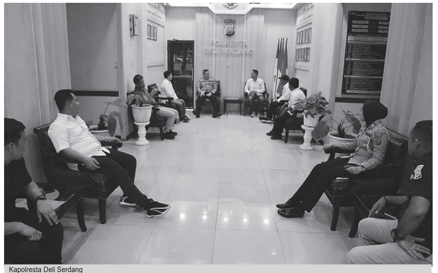
Kapolresta Deli Serdang

Kapolresta menegaskan bahwa peran media sangat penting dalam menyampaikan informasi yang akurat, berimbang, dan dapat dipercaya oleh masyarakat. Ia juga menegaskan sikap terbukanya terhadap berbagai masukan,