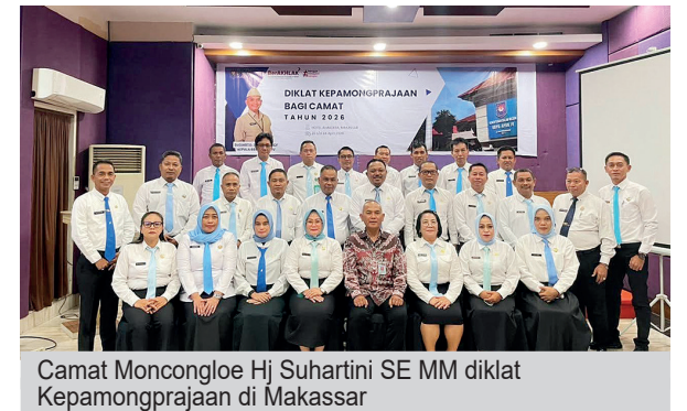
Camat Moncongloe Hj Suhartini SE MM diklat Kepamongrajaan di Makassar