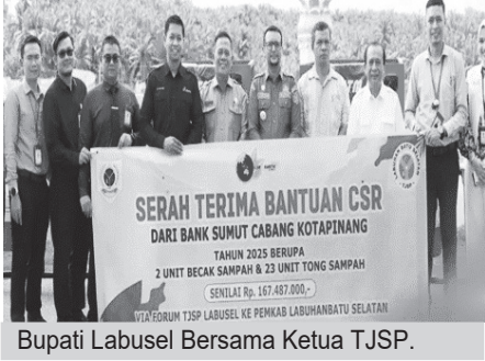
Bupati Labusel Bersama Ketua TJSP.