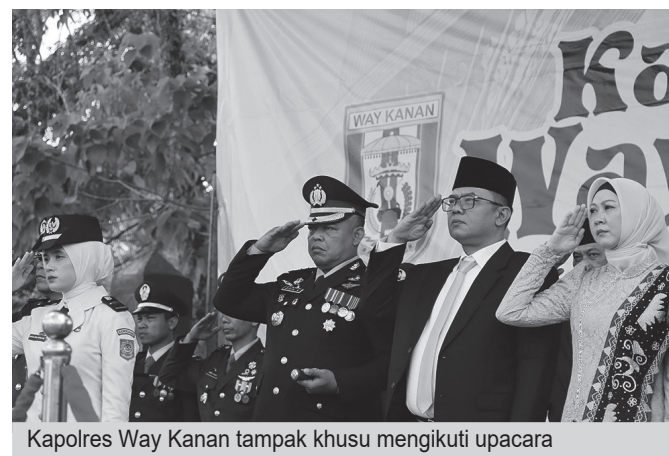
Kapolres Way Kanan tampak khusus mengikuti upacara

Kegiatan juga dihadiri kepala dinas/badan, instansi ver-