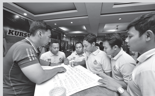
Coach bersertifikat beri pemahaman kepada calon pelatih se Kabupaten Pasuruan

"Yang Pak Bupati inginkan adalah anak-anak di Kabupaten Pasuruan bukan hanya bermain dengan baik, tetapi suatu hari bisa bersaing level yang jauh terus meningkat. Syukur-syukur