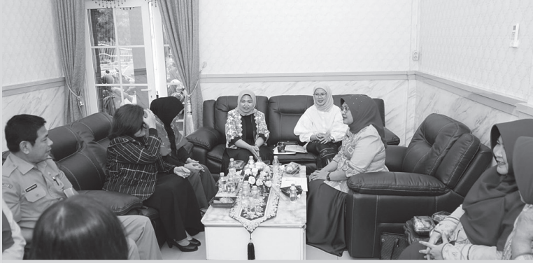
Dekranasda Kota Binjai terima audiensi APPMI Sumatera Utara, Selasa (28/4/2026)

"Pertemuan ini menjadi momentum untuk mempererat silaturahmi sekaligus membuka peluang kerja sama yang bermanfaat bagi