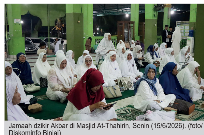
Jamaah dzikir Akbar di Masjid At-Thahirin, Senin (15/6/2026).

“Hijrah harus dimaknai sebagai perubahan menuju kehidupan yang lebih baik, baik secara pribadi maupun dalam kehidupan bermasyarakat,” ujarnya.