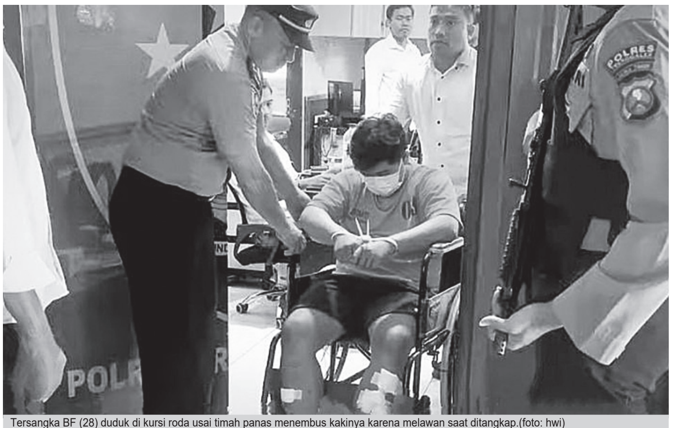
Tersangka BF (28) duduk di kursi roda usai timah panas menembus kakinya karena melawan saat ditangkap. (foto: hwi)

Menurut dia, tim dari Unit Pidum, Satreskrim Polres Trenggalek memburu serta menahan BF usai berhasil menangkap rangkaian kasus penjambratan yang terjadi. Pasalnya, terindikasi ada kemiripan modus pada pola kriminal yang dilakukan.