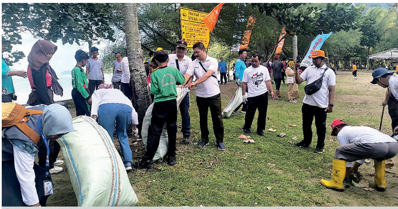
Ratusan orang dari berbagai unsur turut kerja bhakti di Pantai Cengkong Kecamatan Watulimo, Trenggalek.

Menurutnya, melalui program dimaksud, pemerintah daerah mendorong kegiatan kebersihan lingkungan secara rutin dan berkala. Termasuk kerja bakti, olahraga bersama, serta kegiatan bersih-bersih