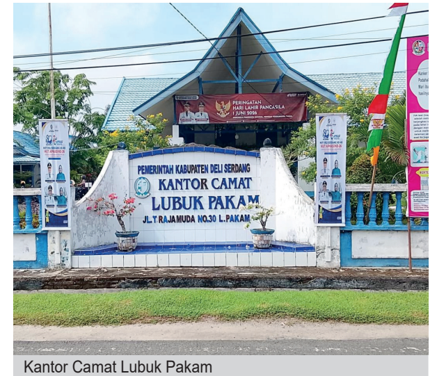
Kantor Camat Lubuk Pakam