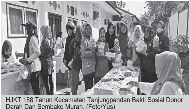
HJKT 188 Tahun Kecamatan Tanjungpandan Bakti Sosial Donor Darah Dan Sembako Murah.

HUT HJKT (Hari Jadi Kota Tanjungpandan ke 188) Kecamatan Tanjungpandan melaksanakan bakti sosial dan donor darah senam sehat dan bazar kebutuhan sembako murah beras, minyak goreng, gula pasir dll bazar kuliner ibu ibu kelompok UP2K berlangsung di halaman kantor Camat Tanjungpandan Kabupaten Belitung Provinsi Kep Babel