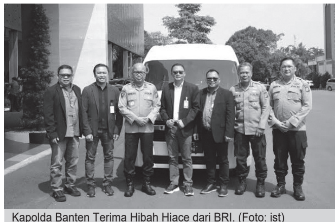
Kapolda Banten Terima Hibah Hiace dari BRI.

Kegiatan tersebut turut dihadiri oleh Pejabat Utama Polda Banten serta tim dari BRI Cabang Serang. Penyerahan hibah kendaraan dinas ini merupakan bentuk dukungan dan sinergitas antara PT Bank Rakyat Indonesia (Persero) dengan Polda Banten dalam mendukung pelaksanaan tugas kepolisian dan peningkatan pelayanan kepada masyarakat.