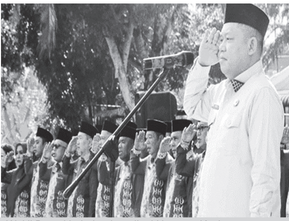
Wakil Bupati Labuhanbatu ikuti Upacara Kesiapan Ekonomi.