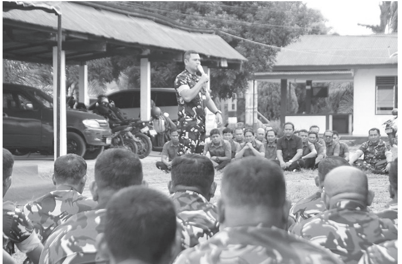
Personil Kodim 0207 Simalungun ketika mendengar arahan Dandim.

Adapun beberapa penekanan yang dikatakan oleh Dandim 0207 Simalungun yakni seluruh jajaran personel guna melakukan penguatan faktor keamanan dalam setiap kegiatan, serta meningkatkan disiplin, loyalitas dan tanggung jawab dalam pelaksanaan tugas sehari-hari, juga menjaga nama baik satuan serta menghindari pelanggaran se-