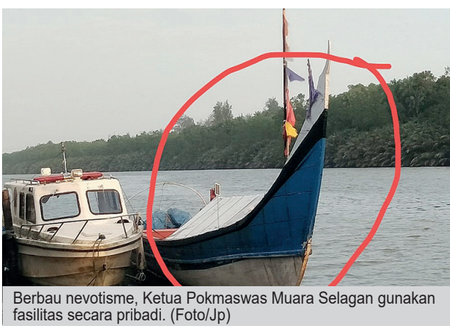
Berbau nepotisme, Ketua Pokmaswas Muara Selagan gunakan fasilitas secara pribadi.