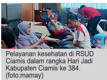
Pelayanan kesehatan di RSUD Ciamis dalam rangka Hari Jadi Kabupaten Ciamis ke 384.

Memperingati Hari Jadi Kabupaten Ciamis ke-384, RSUD Ciamis menggelar serangkaian kegiatan bakti sosial dan kesehatan massal. Momentum ini dijadikan ajang untuk memperkuat