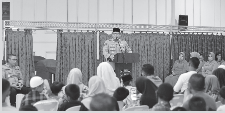
Kapolres Langkat berikan dukungan dan semangat kepada peserta khitanan massal, Rabu (17/6/2026), (foto/ Humas Polres Langkat)

“Melalui kegiatan khitanan massal ini, kami ingin berbagi kebahagiaan serta membantu masyarakat, khususnya keluarga yang membutuhkan. Semoga kegiatan ini memberikan manfaat dan men-