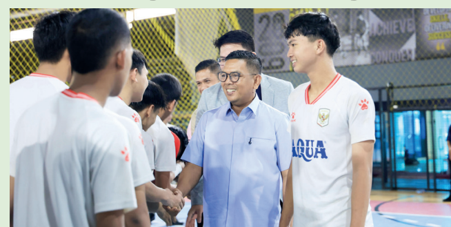
Gubernur Banten Andra Soni saat memberikan semangat kepada Timnas Futsal U-17

capkan selamat bertanding kepada Timnas Futsal U-17 yang nanti akan bertolak menuju Spanyol. Timnas ini akan mengikuti Tourne