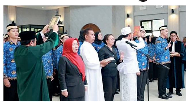
Pengangkatan sumpah para PNS dipandu sesuai agama masing-masing.

Dalam sambutannya, Bupati Maesyal Rasyid menegaskan kepada seluruh PNS yang dilantik agar me-