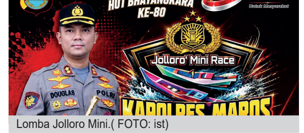
Lomba Jolloro Mini.