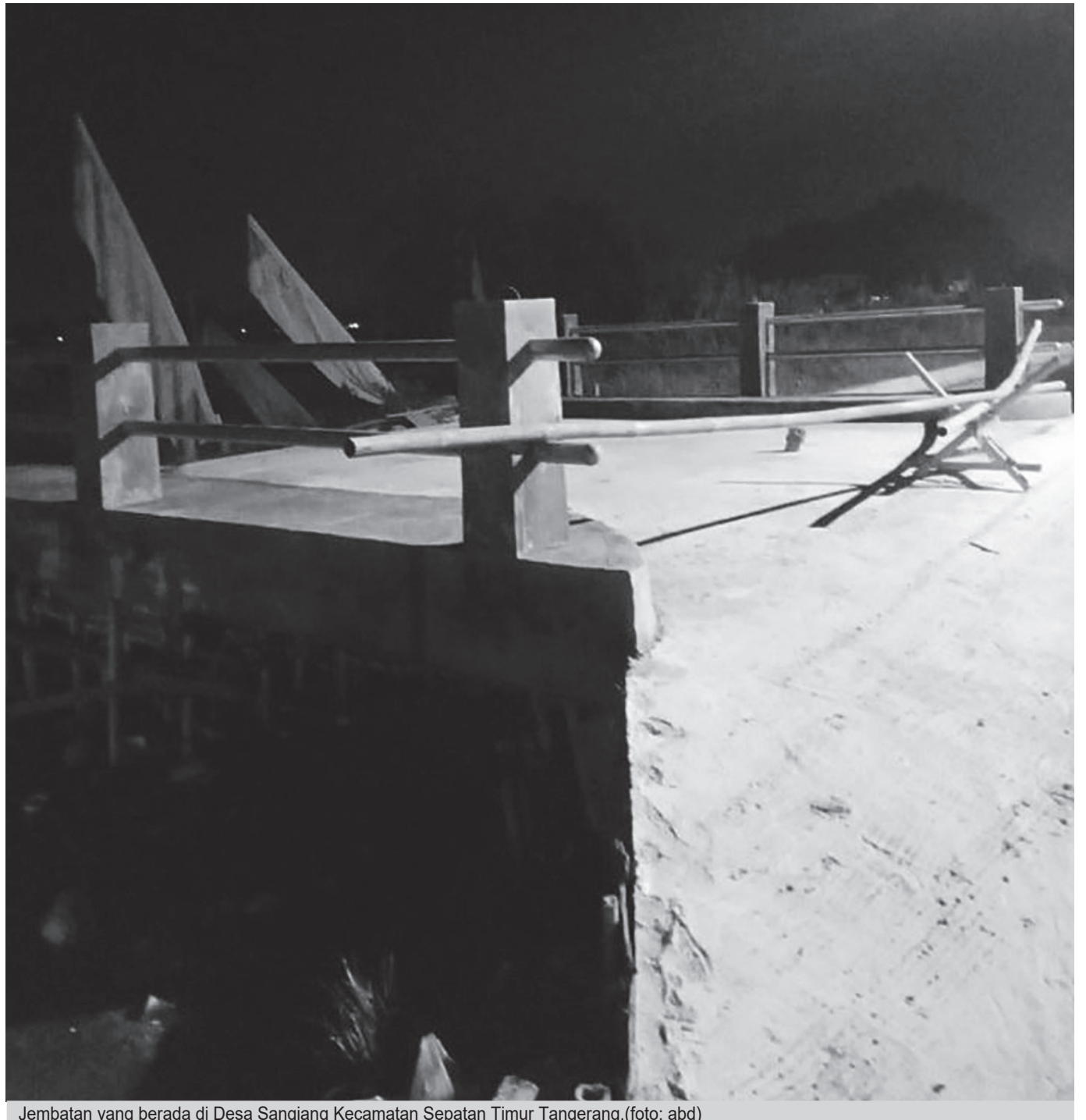
Jembatan yang berada di Desa Sangiang Kecamatan Sepatan Timur Tangerang.(foto: abd)

Dalam surat peringatan tersebut, BBWS Ciliwung Cisadane meminta pihak terkait untuk menghentikan ke-