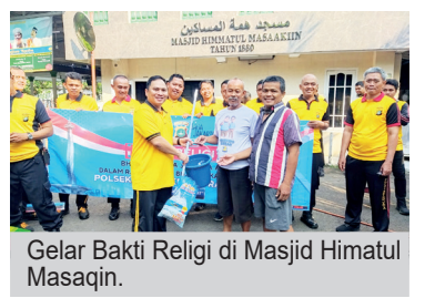
Gelar Bakti Religi di Masjid Himatul Mashaqin.

Dalam rangka menyambut Hari Bhayangkara, Polsek Metro Kebayoran Baru menggelar kegiatan Bakti Religi di Masjid Himatul Mashaqin, Jalan Bacang, Kelurahan Kramat Pela, Keca-