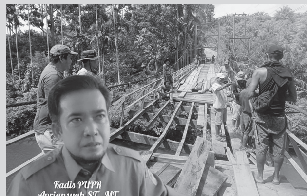
Dimakan usia PUPR usulkan jembatan gantung Talang Buai Permanen.

Apriansyah menambahkan, perkembangan positif mulai terlihat setelah pihak