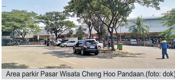
Area parkir Pasar Wisata Cheng Hoo Pandaan.