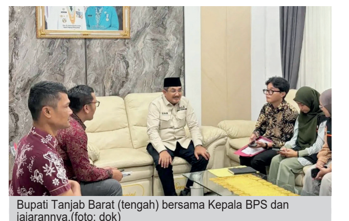
Bupati Tanjab Barat (tengah) bersama Kepala BPS dan jajarannya.