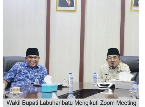
Wakil Bupati Labuhanbatu Mengikuti Zoom Meeting