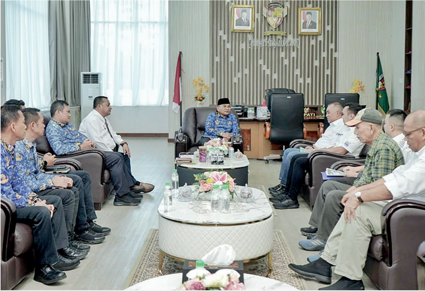
Pemkab Simalungun akan mengadakan Kejuaraan Rally Pasifik 2026 di Agustus.