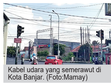
Kabel udara yang semerawut di Kota Banjar.

Pemerintah Kota Banjar (Pemkot Banjar) terus bergerak maju dalam menata estetika dan infrastruktur digital kota. Melalui kerja sama dengan CV Lintas Satu Visi, program penataan kabel udara