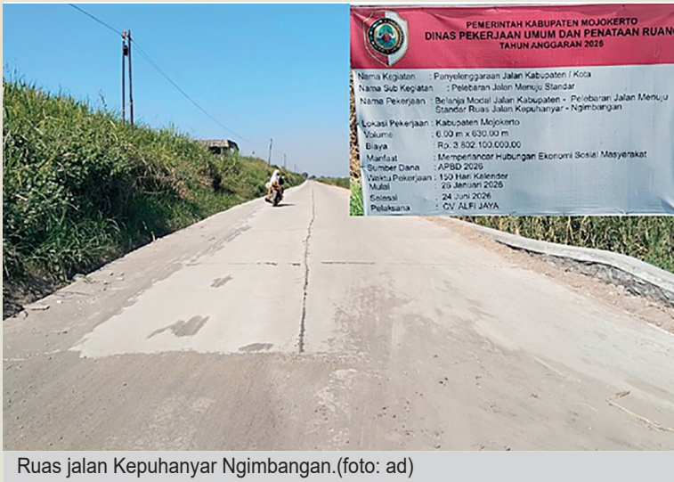
Ruas jalan Kepuhanyar Ngimbangan.

Pembangunan serta peningkatan proyek infrastruktur ruas jalan menuju standar Kepuhanyar-Ngimbangan yang dinahkoda oleh Dinas Pekerjaan Umum