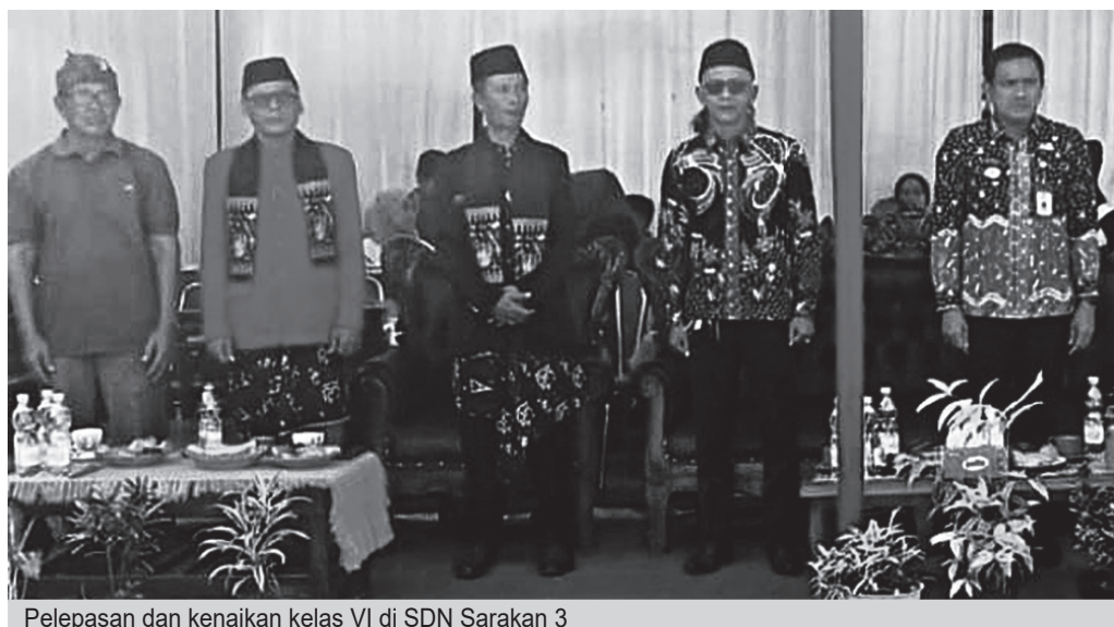
Pelepasan dan kenaikan kelas VI di SDN Sarakan 3

Dalam sambutannya, Camat Sepatan Aan Ansori menyampaikan ucapan selamat kepada seluruh siswa yang telah menyelesaikan pendidikan di tingkat sekolah dasar. Ia berharap para siswa dapat