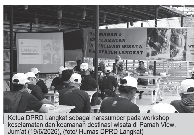
Ketua DPRD Langkat sebagai narasumber pada workshop keselamatan dan keamanan destinasi wisata di Pamah View, Jum'at (19/6/2026), (foto/ Humas DPRD Langkat)

Sementara itu, Kepala Dinas Kebudayaan dan Pari-