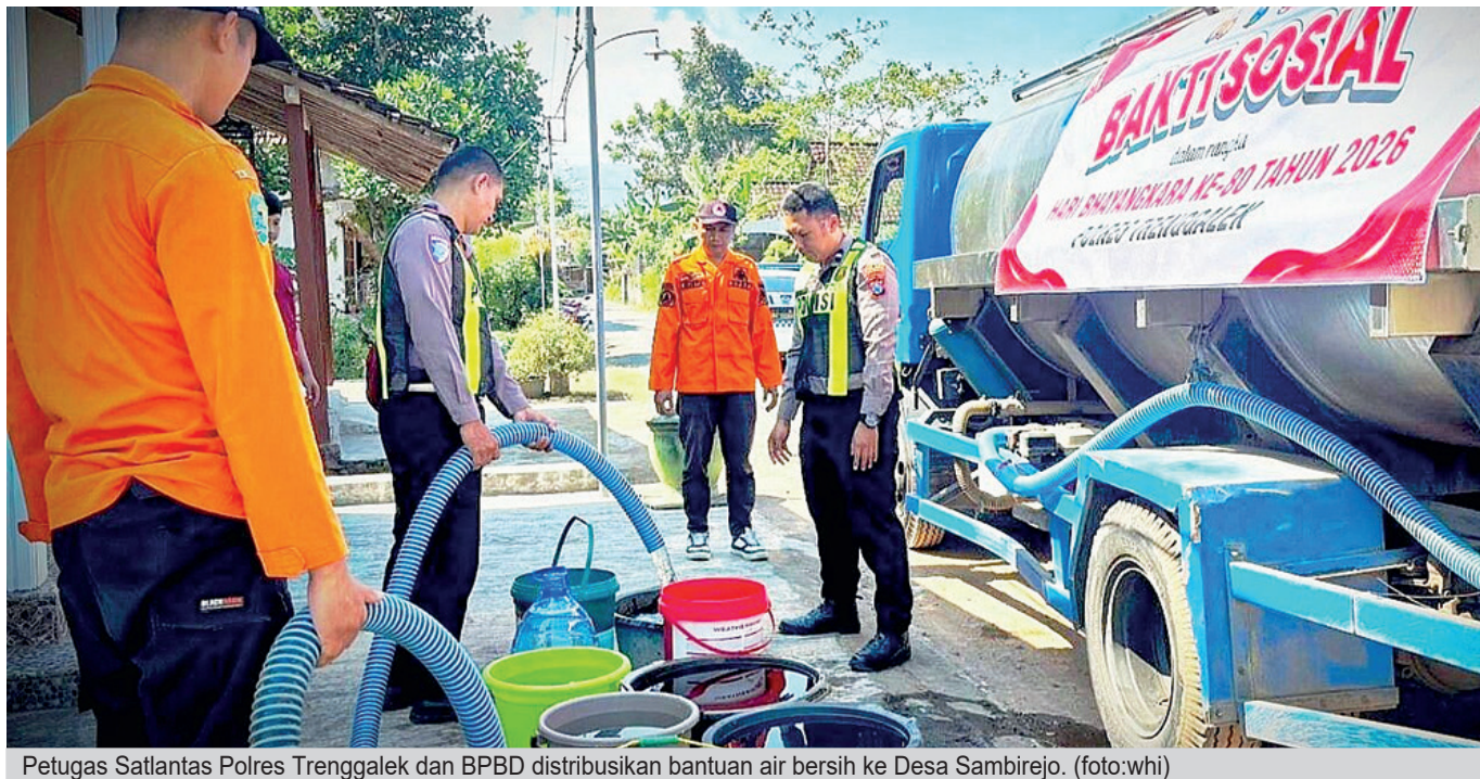
Petugas Satlantas Polres Trenggalek dan BPBD distribusikan bantuan air bersih ke Desa Sambirejo.

Dikonfirmasi Jaya Pos, Kasatlantas Polres Trenggalek AKP Kharisma Afriansyah menyampaikan jika bantuan dimaksud merupakan salah satu wujud kepedulian jajaran kepolisian atas kesulitan yang dialami masyarakat.