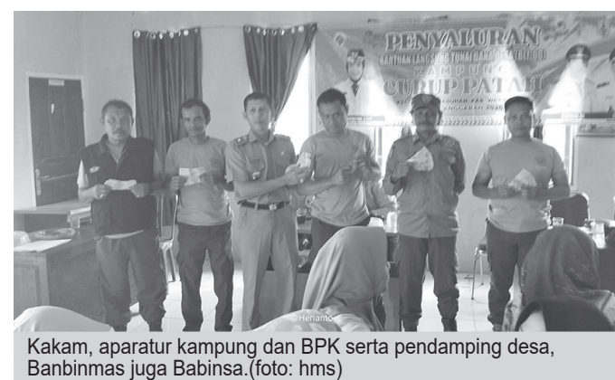
Kakam, aparat kampung dan BPK serta pendamping desa, Banbinmas juga Babinsa.

Program ini merupakan bentuk komitmen pemerintah kampung dalam memperkuat jaringan pengaman sosial di tingkat akar rumput. BLT-DD bertujuan untuk membantu