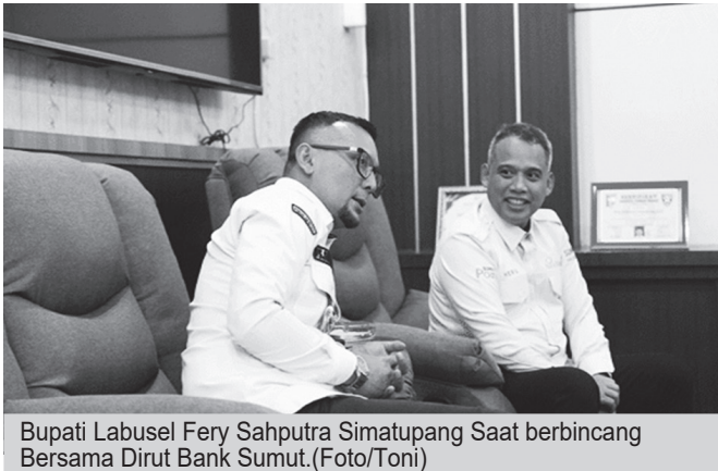
Bupati Labusel Fery Sahputra Simatupang Saat berbincang Bersama Dirut Bank Sumut.

Pertemuan berlangsung dalam suasana hangat dan penuh keakraban sebagai bagian dari upaya mempercepat sinergi antara Pemerintah Kabupaten