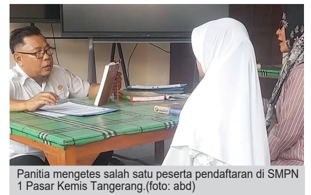
Panitia mengetes salah satu peserta pendaftaran di SMPN 1 Pasar Kemis Tangerang.