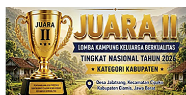
Rangkaian penilaian yang dilalui Kampung KB Jalatrang Creative.

Kabar membanggakan datang dari Kabupaten Ciamis. Kampung Keluarga Berkualitas (Kampung KB) Jalatrang Creative yang terletak di Desa Jalatrang Kecamatan Cipaku, sukses menyabet peng-