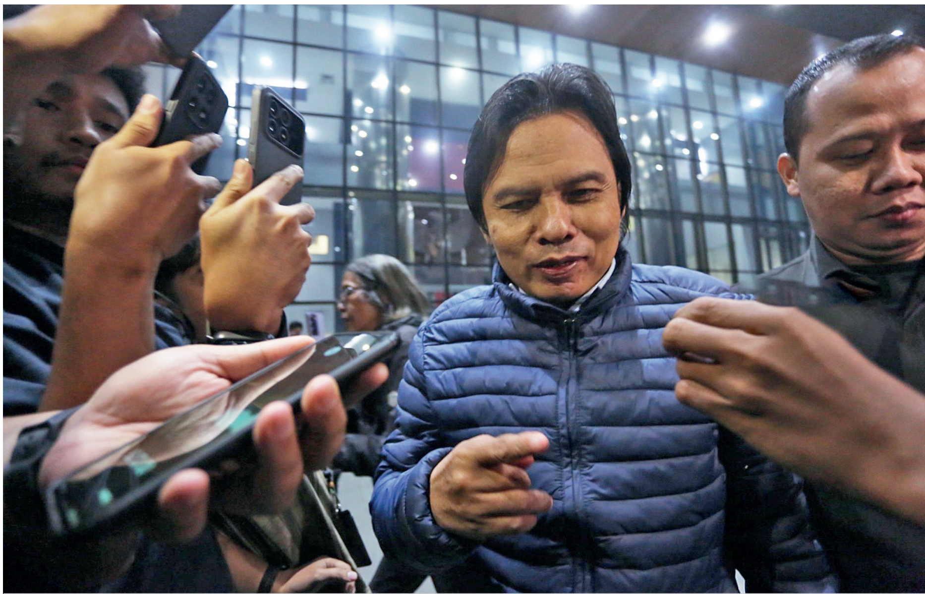
Eks Sekjen MPR Maruf Cahyono usai diperiksa KPK sebagai tersangka dalam kasus dugaan gratifikasi di lingkungan MPR, pada Kamis (25/6/2026).

” Usai ditetapkan jadi tersangka, Sekjen MPR RI Ma’ruf Cahyono tidak dilakukan penahanan oleh KPK, dengan alasan masih dalam tahap mengumpulkan barang bukti tambahan. “