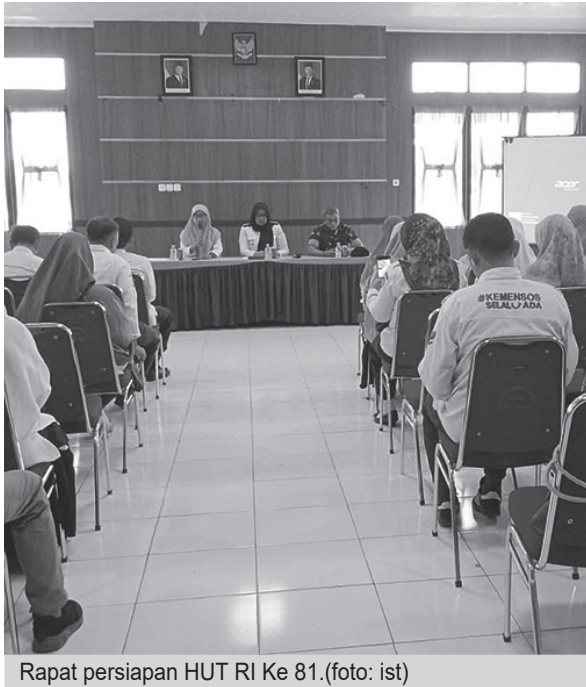
Rapat persiapan HUT RI Ke 81.