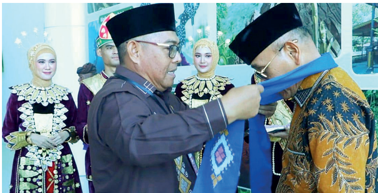
Bupati Simalungun ikuti Penas Petani Nelayan XVII Tahun 2026. (foto: ist)

Setibanya di Gorontalo, Bupati Simalungun mengikuti prosesi penyambutan kebesaran adat Gorontalo “Mototilolo”, sebuah tradisi penghormatan kepada tamu kehormatan yang telah diterima oleh masyarakat Duluwo Limo Lo Pohalaa dan memperoleh restu memasuki wilayah Provinsi Gorontalo.