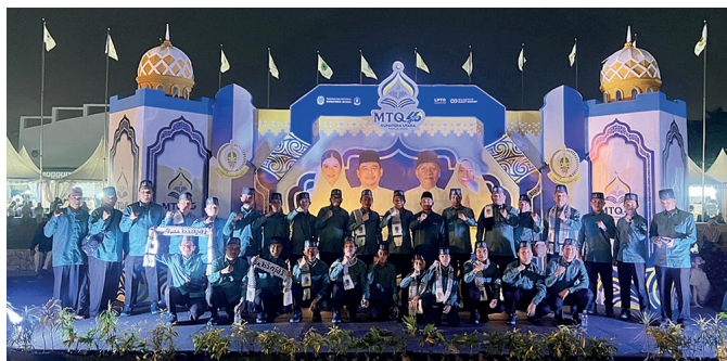
Kafilah Kota Binjai pada ajang MTQ tingkat Provinsi Sumatera Utara tahun 2026 di Deli Serdang, Rabu (24/6/2026).

Penutupan MTQ yang mengusung tema “Satu Irama