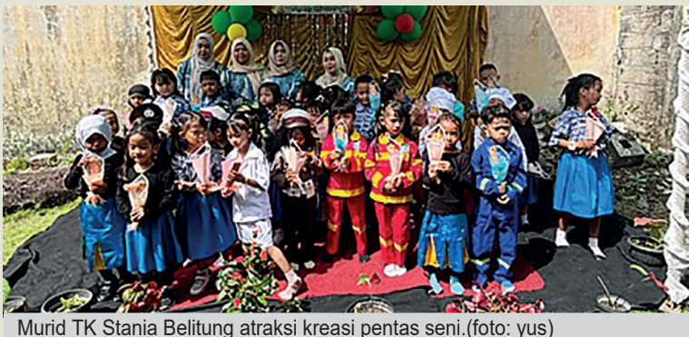
Murid TK Stania Belitung atraksi kreasi pentas seni.

“Selama lebih dari empat dekade berdiri, TK Stania telah meluluskan ribuan anak didik yang kini telah berhasil menempuh pendidikan maupun berkarier di berbagai bidang. Hal itu menja-