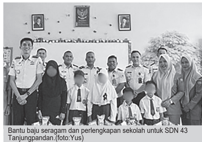
Bantu baju seragam dan perlengkapan sekolah untuk SDN 43 Tanjungpandan.

Kepala Lapas Kelas IIB Tanjungpandan Royhan Al