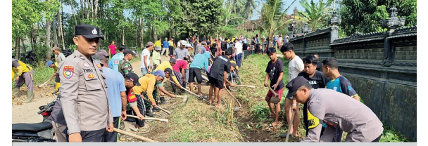
Polri, TNI dan masyarakat gotoroyong memperbaiki jalan poros Kampung Bali.