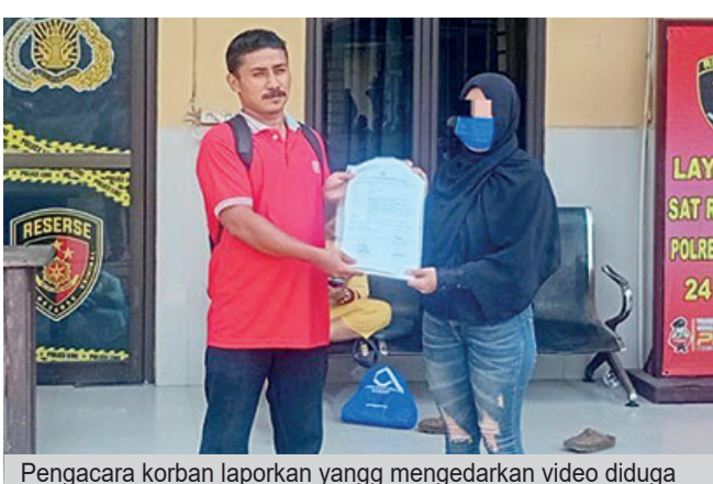
Pengacara korban laporkan yang mengedarkan video diduga asusila.