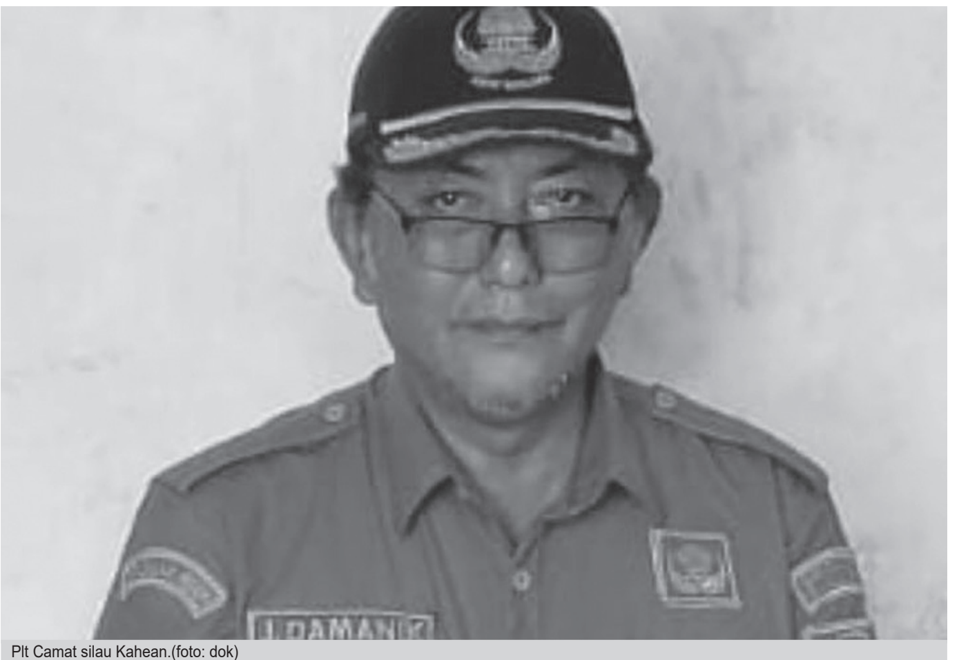
Plt Camat silou Kahean.