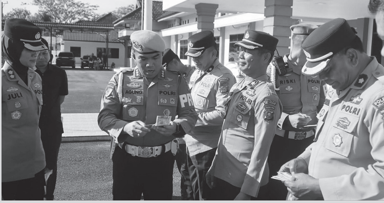
Bid Propam Polda Sumut

Bid Propam Polda Sumut melakukan pemeriksaan disiplin dan sikap tampang personel di Lapangan Apel Polresta Deli Serdang. Selain itu, juga dilaksanakan pemeriksaan urine terhadap personel sebagai upaya pencegahan dan pengawasan penyalahgunaan narkoba di lingkungan Polri.