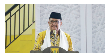
Bupati Sukabumi H Asep Japar.

Bupati Sukabumi H Asep Japar menegaskan pemuda merupakan tulang punggung peradaban. Bahkan di tangan pemuda lah tongkat estafet kepemimpinan umat serta bangsa