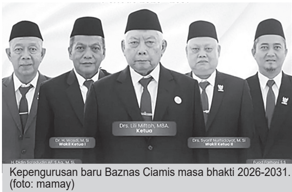
Kepengurusan baru Baznas Ciamis masa bhakti 2026-2031.