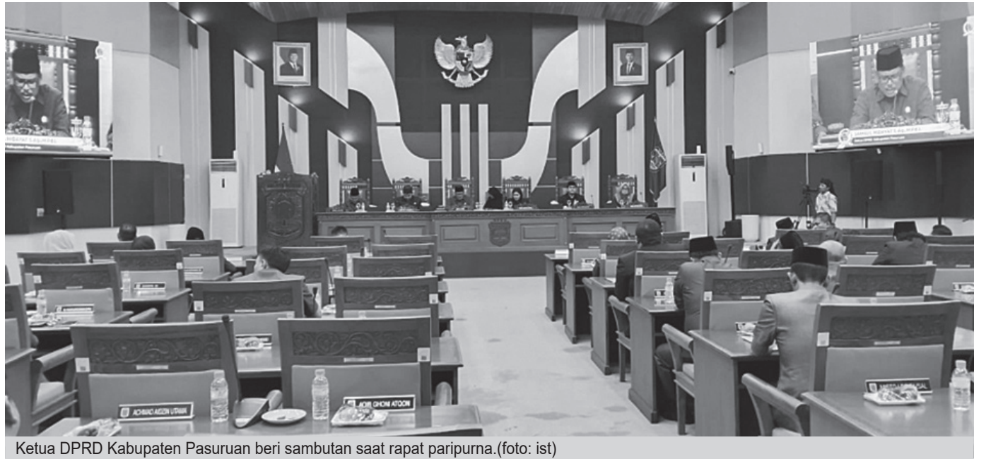
Ketua DPRD Kabupaten Pasuruan beri sambutan saat rapat paripurna.

Dalam rangka penguatan PAD dan efisiensi anggaran,