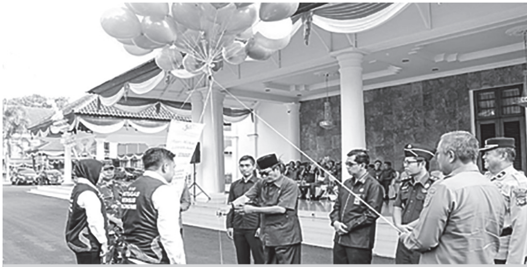
Pemkab Ciamis bersama BPS canangkan pelaksanaan Sensus Ekonomi 2026.

"Data yang akurat akan menghasilkan kebijakan yang tepat, data yang lengkap akan menghasilkan program yang tepat sasaran dan data yang