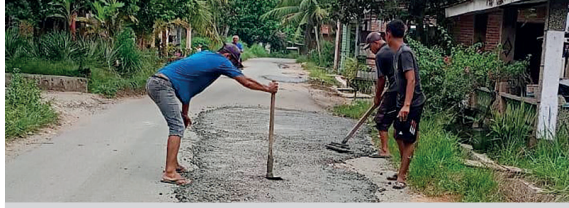
Pengusaha PKS PT BSC di Kecamatan Galang rutin memperbaiki jalan