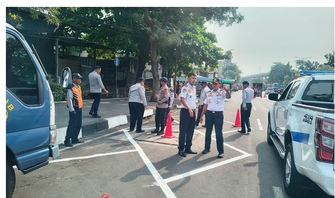
Suku Dinas Perhubungan (Sudinhub) Jakarta Timur resmi menerapkan pengaturan sistem parkir di badan jalan (on street parking).

Secara teknis, pengaturan kapasitas dan pola parkir dibagi ke dalam dua sisi koridor utama Jalan Mayjen Sutoyo.