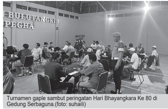
Turnamen gagle sambut peringatan Hari Bhayangkara Ke 80 di Gedung Serbaguna.

Lebih lanjut, Didik mengajak seluruh peserta untuk menjunjung tinggi nilai-nilai