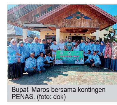
Bupati Maros bersama kontingen PENAS.