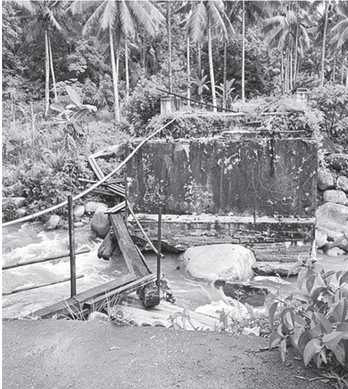
Kondisi jembatan rusak dan jembatan gantung baru.

Melihat kondisi yang semakin mengkhawatirkan, Kepala Desa Malangga, Abd Salam, mengambil langkah cepat dengan membangun jembatan gantung sebagai jalur alternatif. Pembangunan menggunakan Dana Desa dengan melibatkan partisipasi dan gotong royong masyarakat setempat.