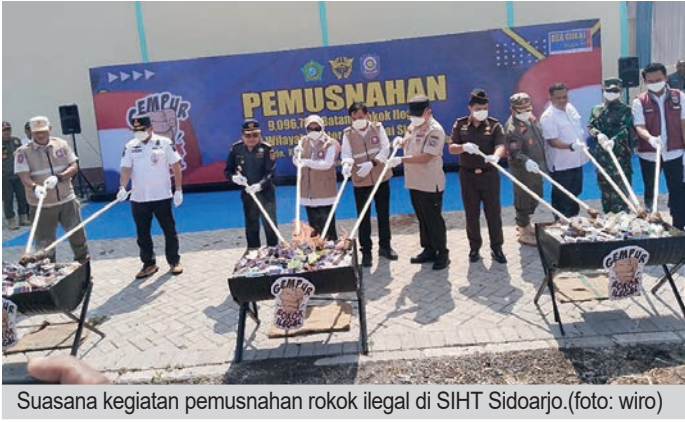
Suasana kegiatan pemusnahan rokok ilegal di SIHT Sidoarjo.