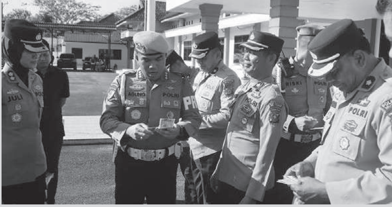
Bid Propam Polda Sumut

Bid Propam Polda Sumut melakukan pemeriksaan disiplin dan sikap tampang personel di Lapangan Apel Polresta Deli Serdang. Selain itu, juga dilaksanakan pemeriksaan urine terhadap personel sebagai upaya pencegahan dan pengawasan penyalahgunaan narkoba di lingkungan Polri.