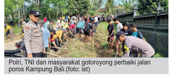
Polri, TNI dan masyarakat gotoroyong perbaiki jalan poros Kampung Bali.