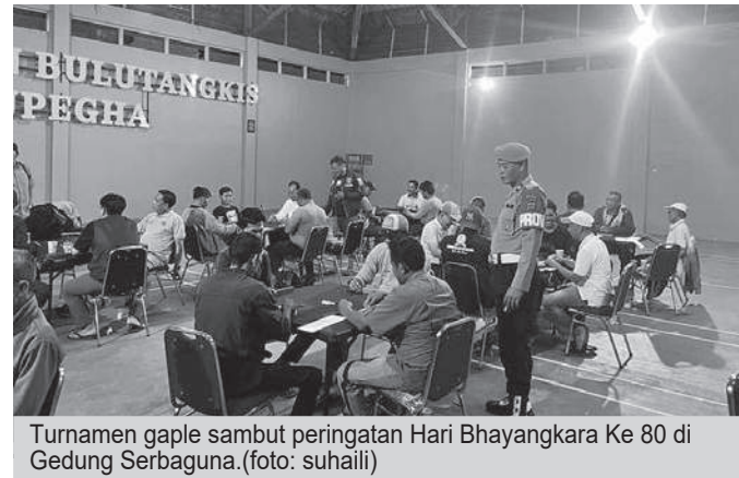
Turnamen gagle sambut peringatan Hari Bhayangkara Ke 80 di Gedung Serbaguna.

Lebih lanjut, Didik mengajak seluruh peserta untuk menjunjung tinggi nilai-nilai