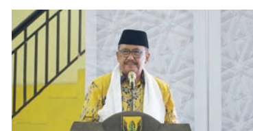
Bupati Sukabumi H Asep Japar.

Bupati Sukabumi H Asep Japar menegaskan pemuda merupakan tulang punggung peradaban. Bahkan di tangan pemuda lah tongkat estafet kepemimpinan umat serta bangsa