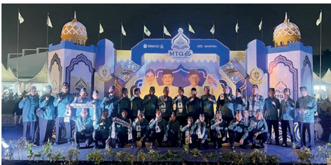
Kafilah Kota Binjai pada ajang MTQ tingkat Provinsi Sumatera Utara tahun 2026 di Deli Serdang, Rabu (24/6/2026).

Penutupan MTQ yang mengusung tema “Satu Irama