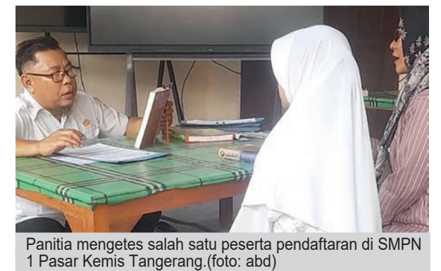
Panitia mengetes salah satu peserta pendaftaran di SMPN 1 Pasar Kemis Tangerang.