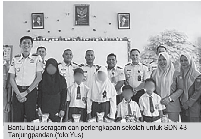
Bantu baju seragam dan perlengkapan sekolah untuk SDN 43 Tanjungpandan.

Kepala Lapas Kelas IIB Tanjungpandan Royhan Al