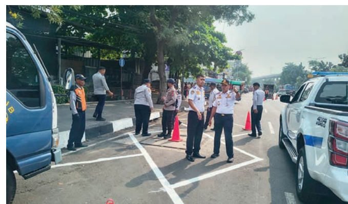
Suku Dinas Perhubungan (Sudinhub) Jakarta Timur resmi menerapkan pengaturan sistem parkir di badan jalan (on street parking).

jat satu baris, kecuali pada pukul 06.00–10.00 WIB. Area tersebut memiliki kapasitas sebanyak 95 Satuan Ruang Parkir (SRP) untuk kendaraan roda empat dan 200 SRP untuk kendaraan roda dua yang terbagi dalam tiga segmen, yaitu dari Pool Bus Primajasa hingga Kantor PT ASABRI (Persero), dari Kantor PT ASABRI hingga Simpang