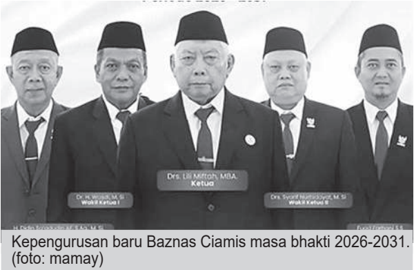
Kepengurusan baru Baznas Ciamis masa bhakti 2026-2031.