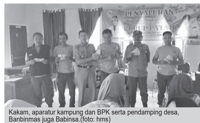
Kakam, aparat kampung dan BPK serta pendamping desa, Banbinmas juga Babinsa.

Program ini merupakan bentuk komitmen pemerintah kampung dalam memperkuat jaringan pengaman sosial di tingkat akar rumput. BLT-DD bertujuan untuk membantu