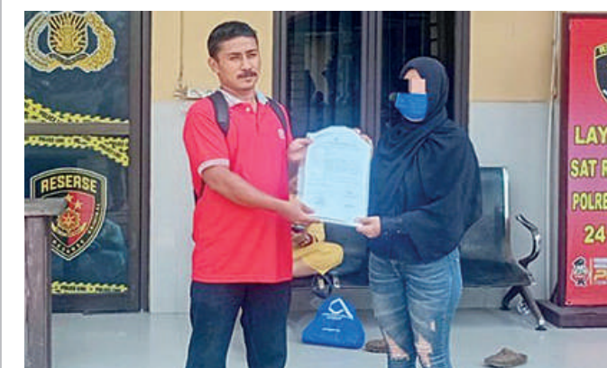
Pengacara korban laporkan yang mengedarkan video diduga asusila.