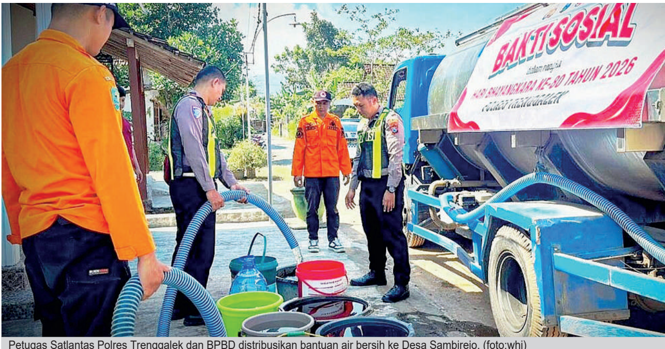
Petugas Satlantas Polres Trenggalek dan BPBD distribusikan bantuan air bersih ke Desa Sambirejo.