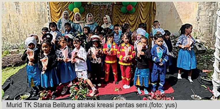
Murid TK Stania Belitung atraksi kreasi pentas seni.

“Selama lebih dari empat dekade berdiri, TK Stania telah meluluskan ribuan anak didik yang kini telah berhasil menempuh pendidikan maupun berkarier di berbagai bidang. Hal itu menja-