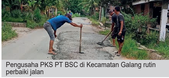
Pengusaha PKS PT BSC di Kecamatan Galang rutin memperbaiki jalan