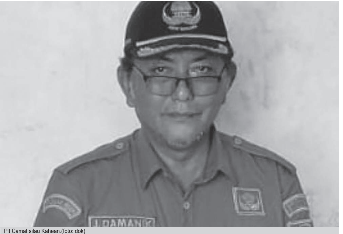
Plt Camat silou Kahean.