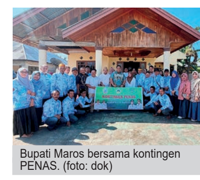
Bupati Maros bersama kontingen PENAS.