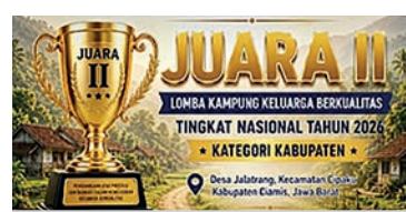
Rangkaian penilaian yang dilalui Kampung KB Jalatrang Creative.

Kabar membanggakan datang dari Kabupaten Ciamis. Kampung Keluarga Berkualitas (Kampung KB) Jalatrang Creative yang terletak di Desa Jalatrang Kecamatan Cipaku, sukses menyabet peng-