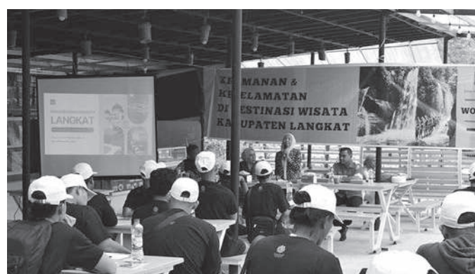
Ketua DPRD Langkat sebagai narasumber pada workshop keselamatan dan keamanan destinasi wisata di Pamah View, Jum'at (19/6/2026), (foto/ Humas DPRD Langkat)

Sementara itu, Kepala Dinas Kebudayaan dan Pari-