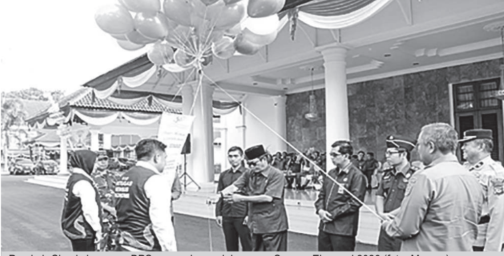
Pemkab Ciamis bersama BPS canangkan pelaksanaan Sensus Ekonomi 2026.

"Data yang akurat akan menghasilkan kebijakan yang tepat, data yang lengkap akan menghasilkan program yang tepat sasaran dan data yang